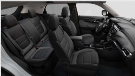
ריפודי בד בצבע שחור