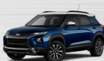
כחול דיו מטאלי - גג לבן - GGK

● האבזור והרכיבים המופיעים במפרט זה הם האבזור והרכיבים הקיימים בדגמי כלי הרכב. בשל משבר השבבים העולמי, יתכן שבחלק מכלי הרכב אבזור מסוים ו/או רכיבים מסוימים – המצוינים במפרט כקיימים – לא יהיו פעילים ותידרש השלמה של השבבים הנחוצים להפעלתם. כאשר השבבים הנדרשים להפעלת האבזור ו/או הרכיבים יהיו זמינים, הם יותקנו בכלי הרכב ללא עלות נוספת.