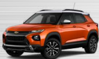
כתום מטאלי - גג לבן - GHD