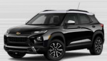
שחור מטאלי - גג לבן - GB0