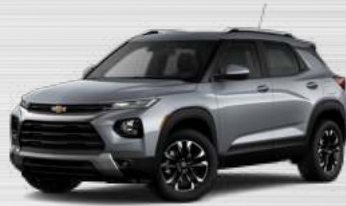
אפור סטרלינג מטאלי - GZB