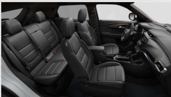
ריפוד דמוי עור שחור דגשי חום אריזונה בתא הנוסעים - HW3