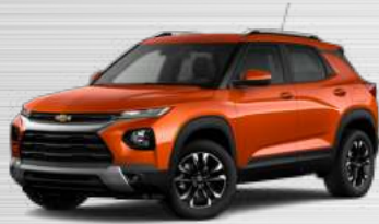
כתום מטאלי - GHD