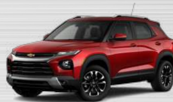
אדום קטיפה מטאלי - GFM