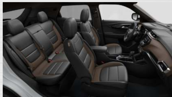
ריפוד דמוי עור שחור בשילוב חום שקד לוח מחוונים חום שקד - HW2