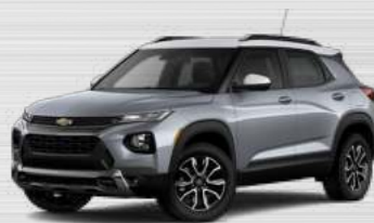
אפור סטרלינג מטאלי - גג לבן - GZB