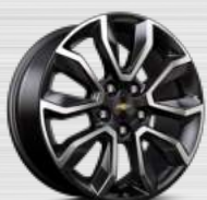
ACTIV Z (17")