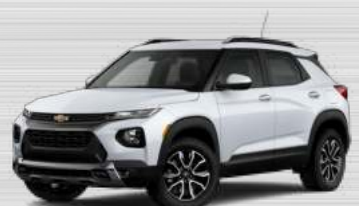
לבן פסגה - גג לבן - GAZ