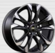
LT+ / LTZ (17")