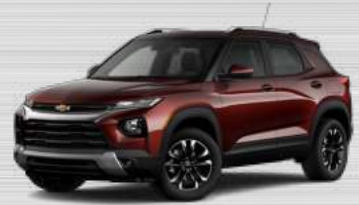
חום מהגוני מטאלי - GHL