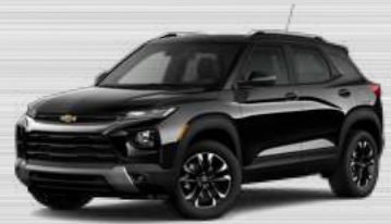
שחור מטאלי - GB0