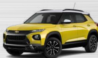
צהוב ניטרו מטאלי - גג לבן - GHS