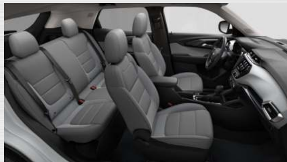
ריפודי בד בצבע אפור