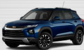
כחול דיו מטאלי - GGK