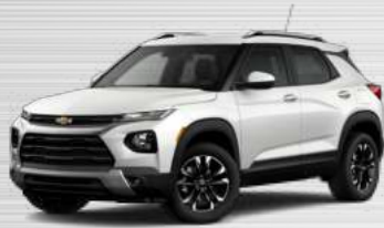
לבן שלג מטאלי - GP5