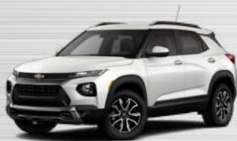
לבן שלג מטאלי - גג לבן - GP5