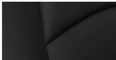
ריפוד בד בגוון שחור