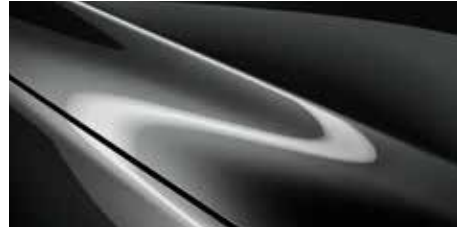
אפור עשיר (46G)*