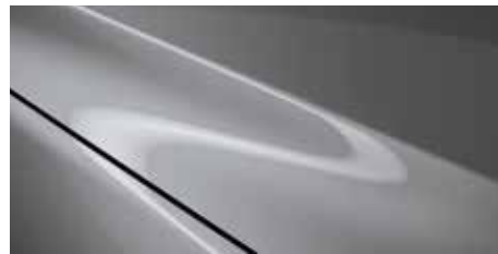
אפור בטון (52C)