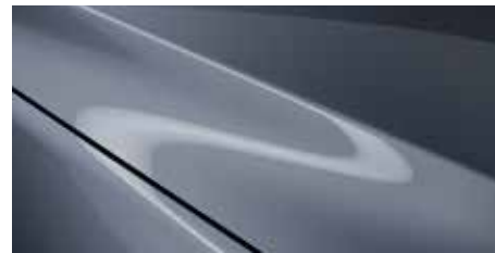
כחול מתכתי (47C)