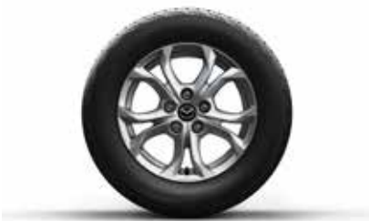
חישוקי סגסוגת 16"