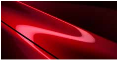
אדום עשיר נוצץ (46V)*