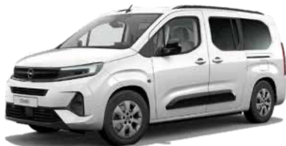
רמת גימור ELEGANCE PLUS – 7 מושבים