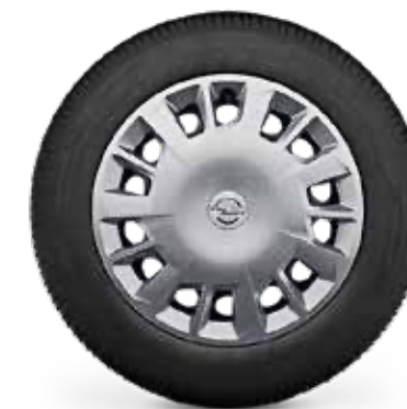
חישוקי פלדה 16" לדגמי EDITION PLUS 5 מושבים