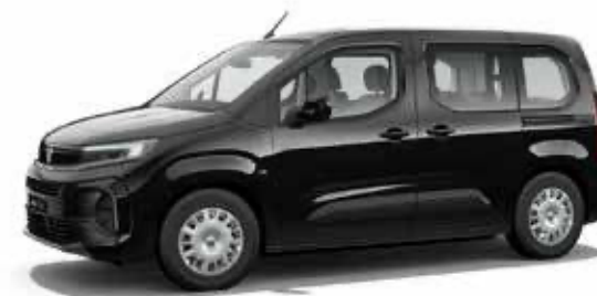
Perla Black שחור מטאלי