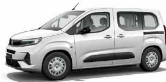
Icy White לבן