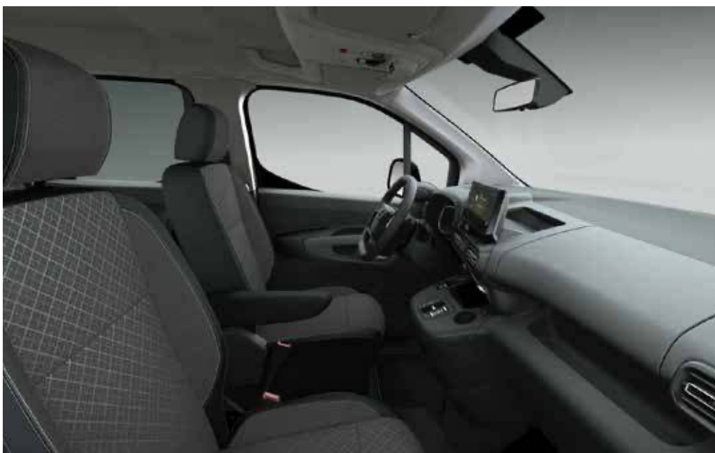
ריפוד בד בצבע אפור משולב עם שחור