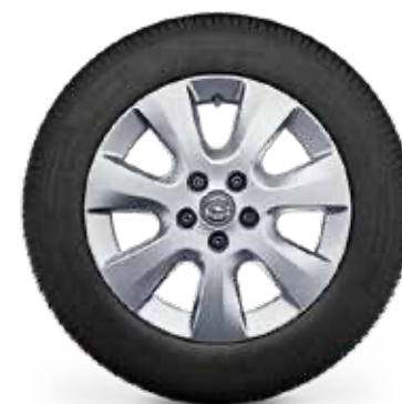
חישוקי סגסוגת 16" לדגמי ELEGANCE PLUS 7 מושבים