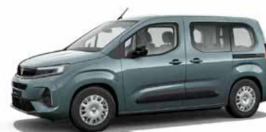
Libeccio Blue כחול מטאלי