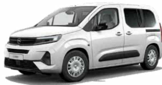
רמת גימור EDITION PLUS – 5 מושבים