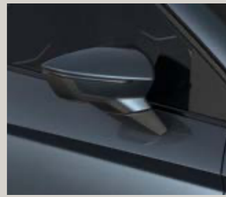
אפור מטאלי S7S7