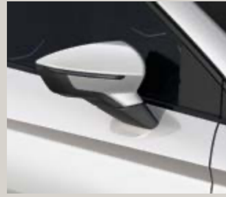
לבן נבאדה 2Y2Y