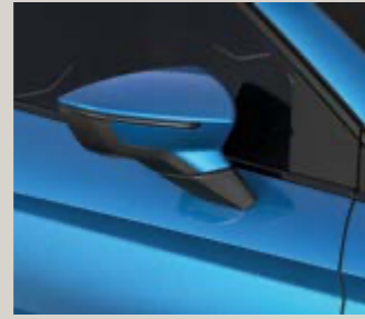
ואומו כחול ספיר