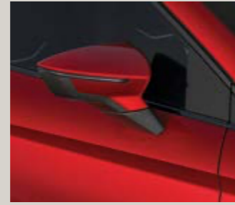
אדום כהה יין 4E4E