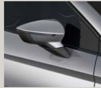
כסף מטאלי L5L5