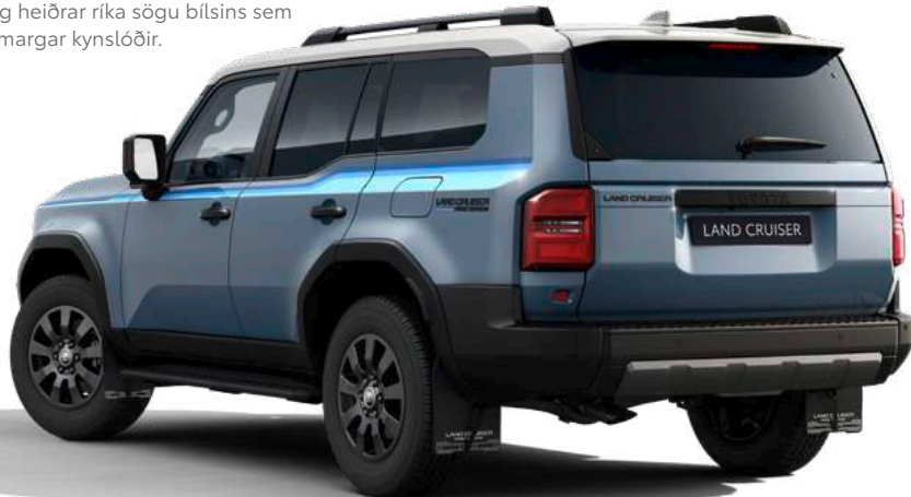
PAKKI 1 Blátt litapema

Toyota Land Cruiser First Edition-pakinn, samanstendur af teppamottum, límniðaskreytingum með fortíðar ívafi og aurhlífum. Pakinn undirstrikar arfleifð Land Cruiser og heiðrar ríka sögu bílsins sem spannar margar kynslóðir.