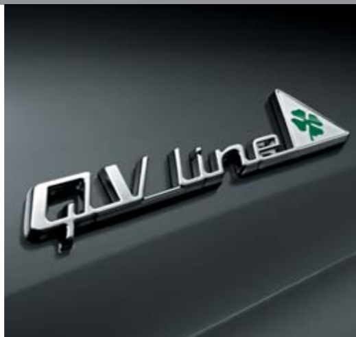
◉ Badge QV Line