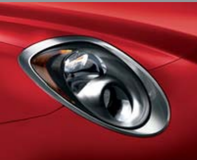
◉ Cornice Cromo Satinato