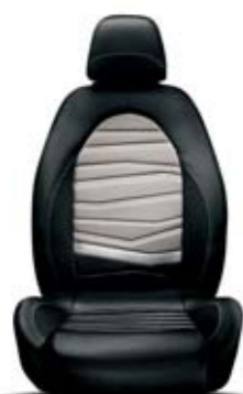
Sprint Nero-Crema 313