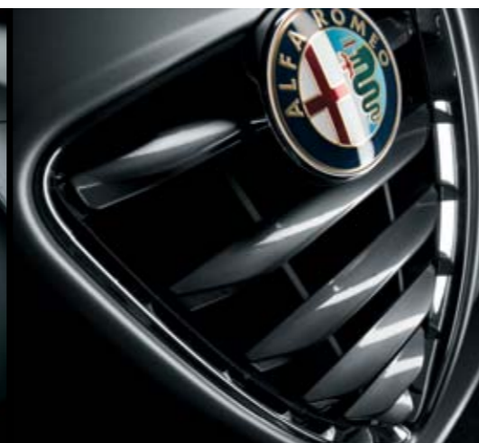
◉ Finiture Antracite Lucide su calandra