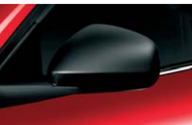
◉ Calotta Nero Opaco