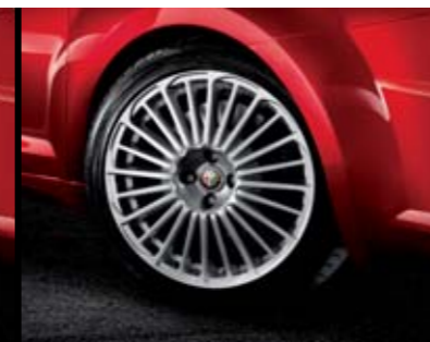
◉ 432 - Cerchi in lega Silver Style 17" 205/45