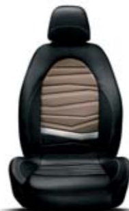
Tessuto Sprint Nero-Bronzo