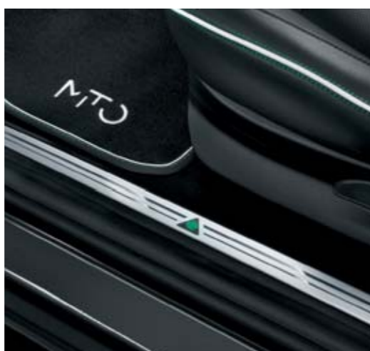
◉ Batticalcagno personalizzato QV