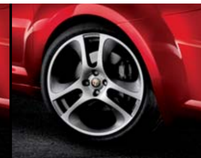
◉ 439 - Cerchi in lega Silver Sport 18" 215/45