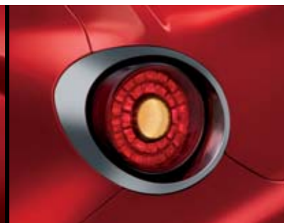
◉ Cornice Grigio Titanio