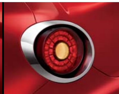
◉ Cornice Cromo Lucido