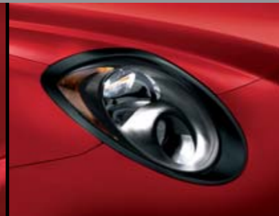
◉ Cornice Nero Opaco