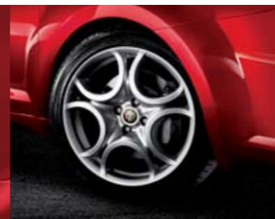
◉ 431 - Cerchi in lega Silver Sport 17" 215/45