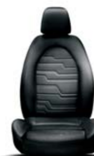
Tessuto Sprint Nero-Nero