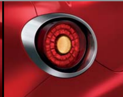
◉ Cornice Cromo Satinato