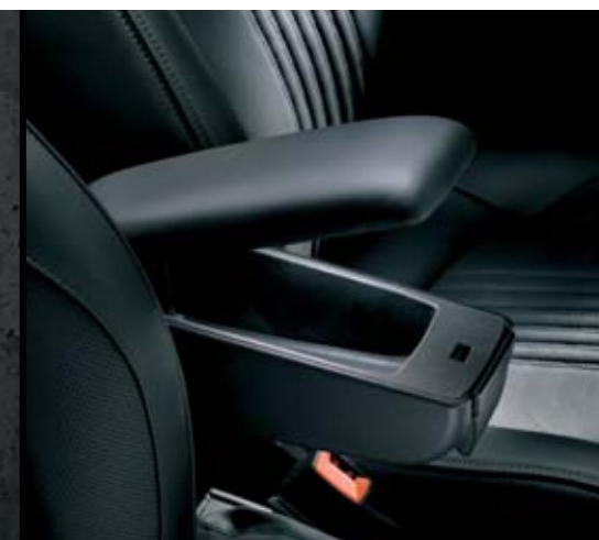
◉ Bracciolo anteriore con vano portaoggetti