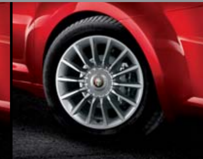
◉ 4WQ/5EQ - Cerchi in lega Silver Style 16" 195/55