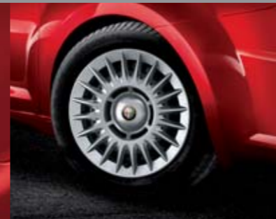
◉ Cerchi in acciaio 15" 185/65