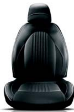
Pelle Frau® Nero (cadenino Bianco e cuciture Verdi) 417