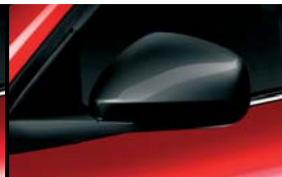
◉ Calotta Nero Lucido