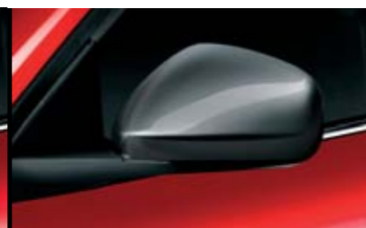
◉ Calotta Antracite Lucido