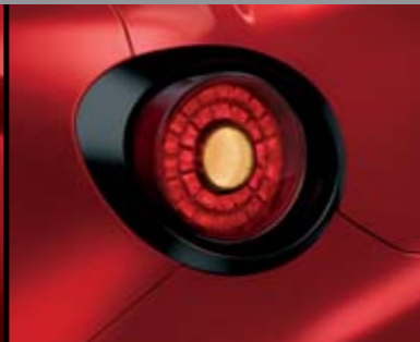
◉ Cornice Nero Opaco