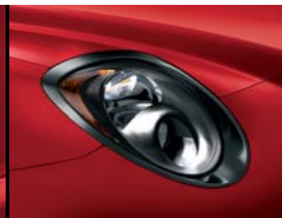
◉ Cornice Nero Lucido