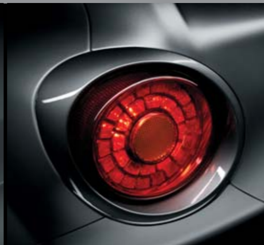
◉ Finiture Antracite Lucide su cornici fari posteriori