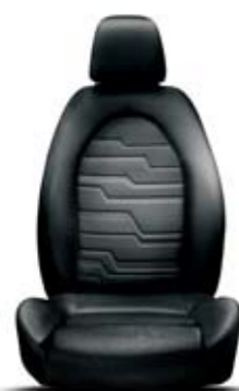
Sprint Nero-Nero 121