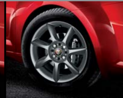
◉ 5A6 - Cerchi in lega Silver Style 15" 185/65