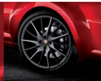
◉ 55E - Cerchi in lega Titanium Quadrifoglio Verde 18" 215/40