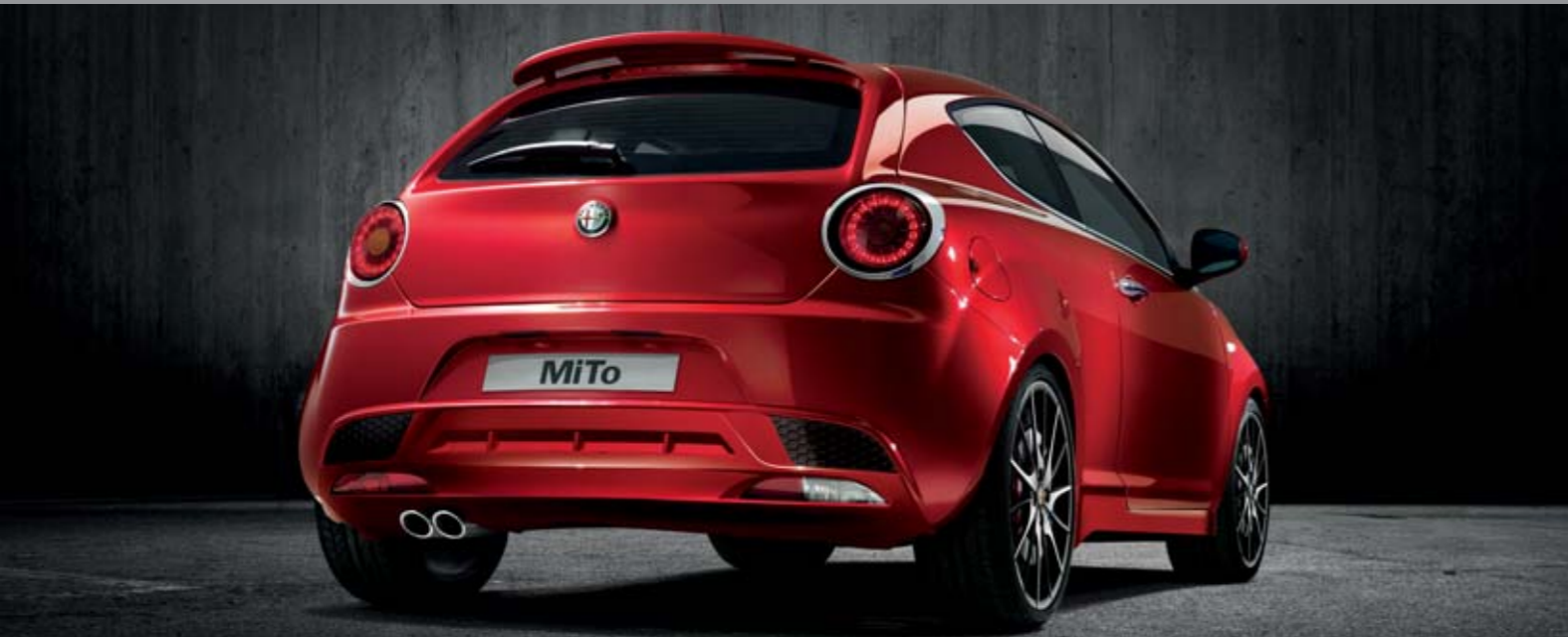
Body kit sportivo con minigonne e dam posteriore