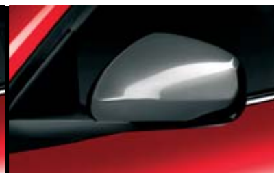
◉ Calotta Cromo Lucido