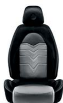
Evoluzione Nero-Fascia PVC Titanio 370