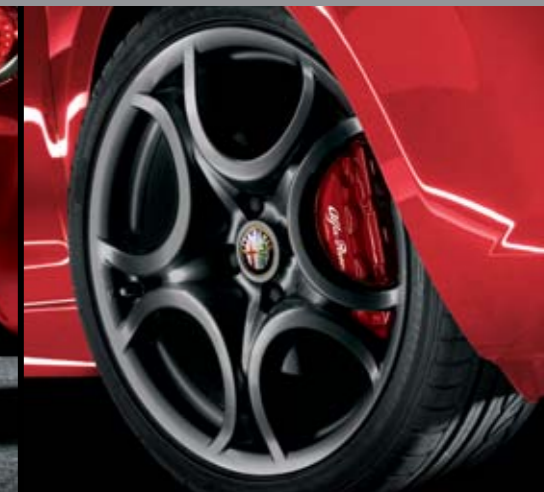
◉ Pinze freni rosse