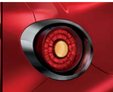
◉ Cornice Antracite Lucido