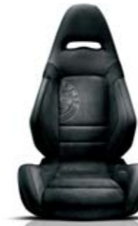
Sabelt® (opt) Nero - Logo Alfa Romeo Tessuto tecnico e Alcantara® Cuciture Bianco-Verdi