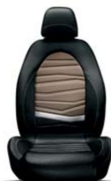
Sprint Nero-Bronzo 323