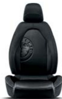
Tessuto Heritage Nero Logo Alfa Romeo - Cuciture Bianco-Verdi

Fuori assetto da competizione, dentro abitacolo sportivo. Ma MiTo Quadrifoglio Verde non è soltanto estetica. Sotto al cofano, il motore 1.4 MultiAir Turbobenzina da 170 CV con cambio automatico TCT è in grado di sviluppare valori di potenza specifica tra i più elevati: 124 CV/Litro. Performance che, unite al sorprendente rapporto peso potenza di 6,7 kg/CV, garantiscono agilità senza paragoni. Questo propulsore consente a MiTo Quadrifoglio Verde di accelerare da 0 a 100 km/h in soli 7,3 secondi.