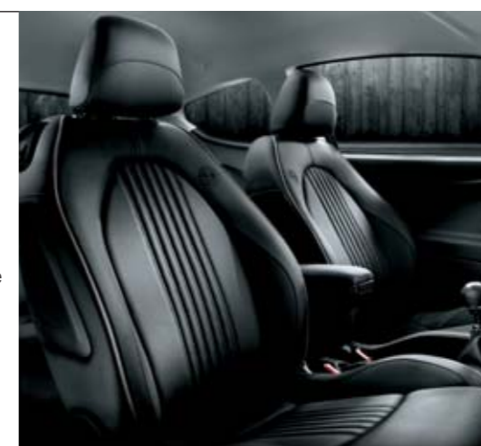
◉ Sedili in pelle