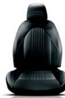
Pelle Frau® (opt) Nero Cadenino Bianco - Cuciture Verdi