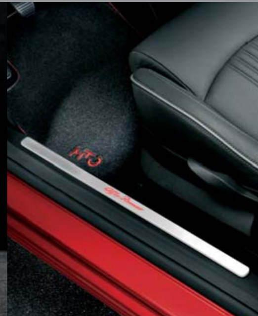
Kit batticalcagno illuminato più tappeto in velluto