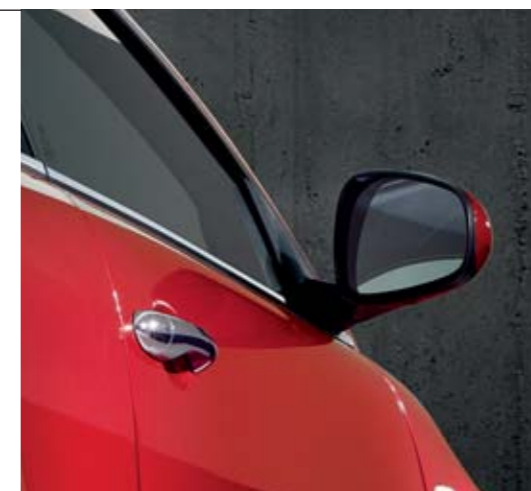
◉ Specchi retrovisori esterni elettrici e riscaldati