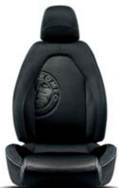
Heritage Nero (cuciture Bianco-Verdi) 530