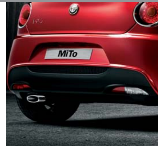
◉ Paraurti sportivo con estrattore