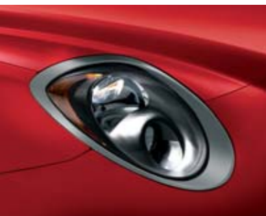
◉ Cornice Grigio Titanio