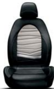
Tessuto Sprint Nero-Crema