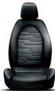
Tessuto Sprint Nero-Nero