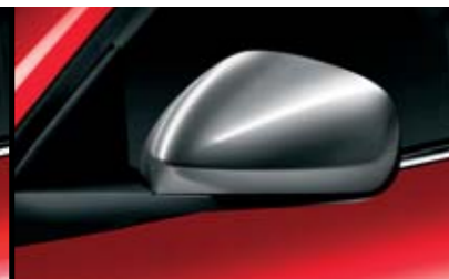
◉ Calotta Cromo Satinato