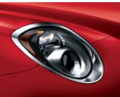
◉ Cornice Cromo Lucido