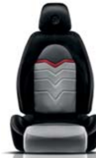
Tessuto Evoluzione Nero - Fascia PVC Rosso