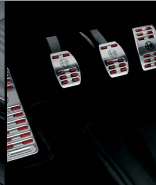
Kit pedaliera sportiva