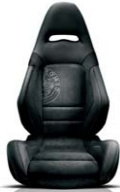
Sabelt® Nero (cuciture Bianco-Verdi) 527