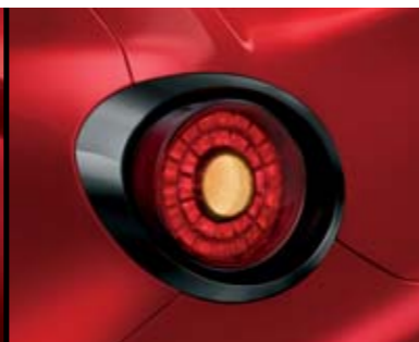
◉ Cornice Nero Lucido