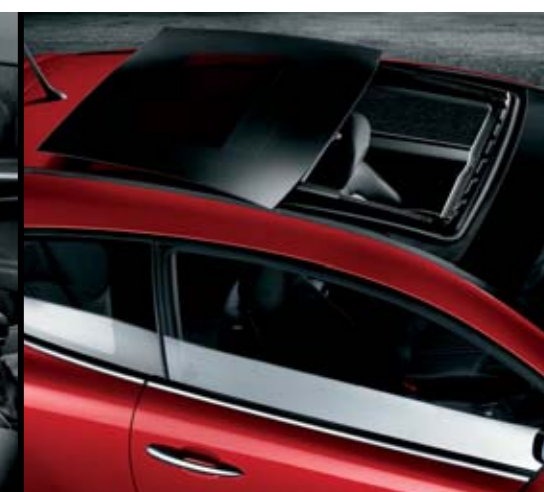
◉ Sky Window