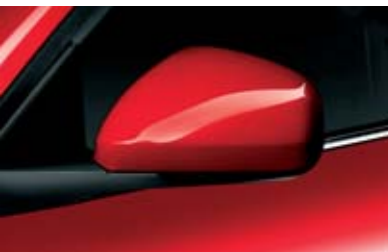
◉ Calotta Colore Carrozzeria