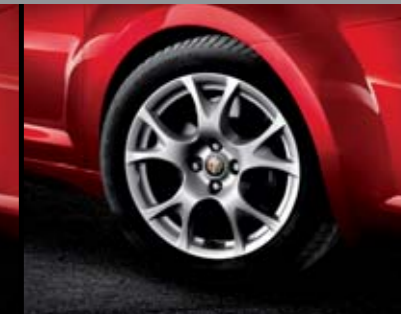
◉ 108/421 - Cerchi in lega Silver Sport 16" 195/55