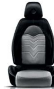
Tessuto Evoluzione Nero - Fascia PVC Titanio