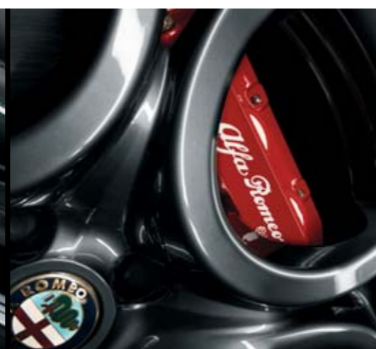
◉ Cerchi in lega Titanium Sport 17" a 5 fori con finiture bruite