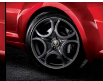
◉ 420 - Cerchi in lega Titanium Sport 17" 215/45