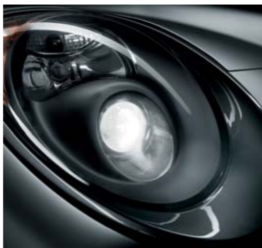
◉ Finiture Antracite Lucide su cornici fari anteriori