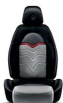
Evoluzione Nero-Fascia PVC Rossa 305