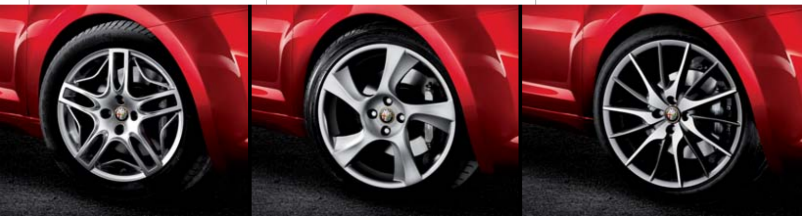
Cerchi in lega da 18"