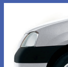
D69 GRIGIO PLATINO