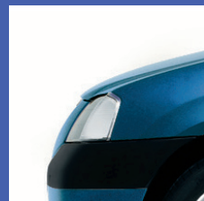
RNF BLU MINERALE