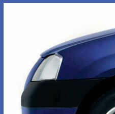
61H BLU MARINA