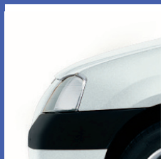
369 BIANCO GHIACCIO