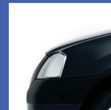
676 NERO NACRÉ