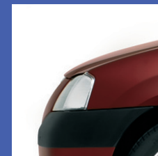
B76 ROSSO FUOCO