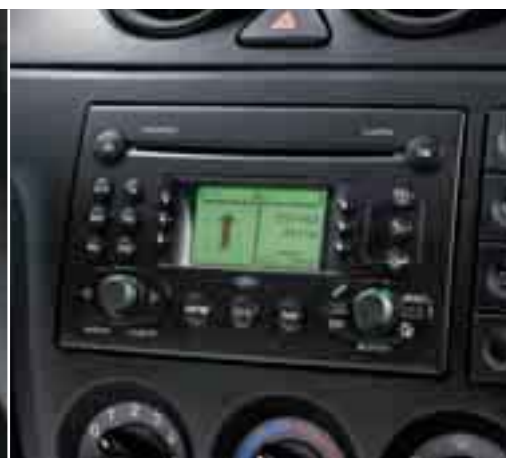
Navigatore satellitare Il Sistema di Navigazione Satellitare Ford, che combina una radio, un lettore CD e un sistema di navigazione, vi condurrà facilmente fino alla vostra destinazione finale.