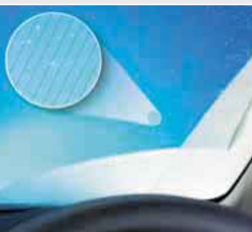
Sbrinatori rapidi parabrezza In avverse condizioni del tempo, con lo sbrinatori rapidi potete rimuovere la neve e il ghiaccio dal parabrezza spingendo semplicemente un tasto.