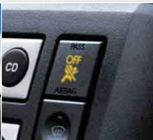
Interruttore di disattivazione airbag passeggero anteriore* Un interruttore permette di disattivare l'airbag del sedgiolino anteriore nel caso si debba montare sul sedile un seggiolino di sicurezza per bambini (disponibile come accessorio Ford).