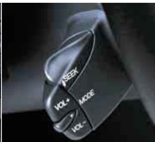
Comandi al volante Tutti i modelli audio Ford sono dotati di comandi al volante.