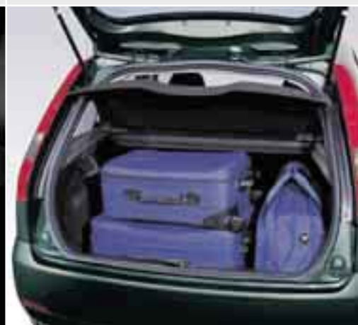
Bagagliaio Vivi in un mondo reale, la nuova Ford Fiesta anche. Per questo il bagagliaio può trasportare qualsiasi cosa, un passeggino per bambini, scatole ingombranti, o due valigie e un paio di sacche sportive per la fine settimana fuori città.