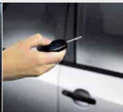
Chiusura a distanza I modelli fiesta offrono una chiusura delle portiere centralizzata e a distanza, per una maggiore sicurezza e praticità.