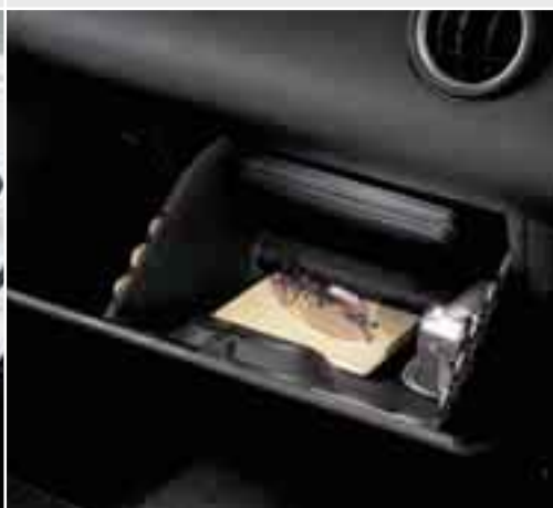
Ampi vani portaoggetti Con vani portapenne, portamonete e portabiglietti ed uno spazio per il tuo manuale, i vani portaoggetti di Ford Fiesta possono contenere davvero di tutto.