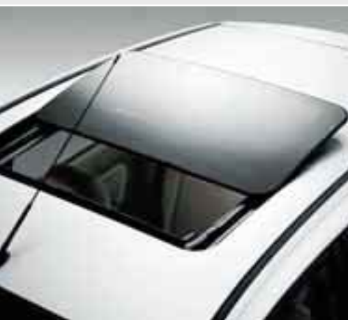
Tettino apribile Il tettino apribile di vetro di Ford Fiesta si inclina e scivola, permettendo a te ed ai tuoi passeggeri di godere di un po' di aria fresca.