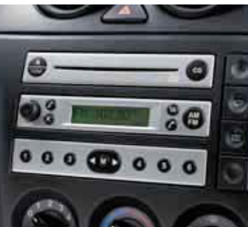
Radio stereo e lettore CD – Modello 6006 RDS EON con caricatore di 6 CD integrato nel cruscotto, sistema antifurto "keycode" e 4 altoparlanti.