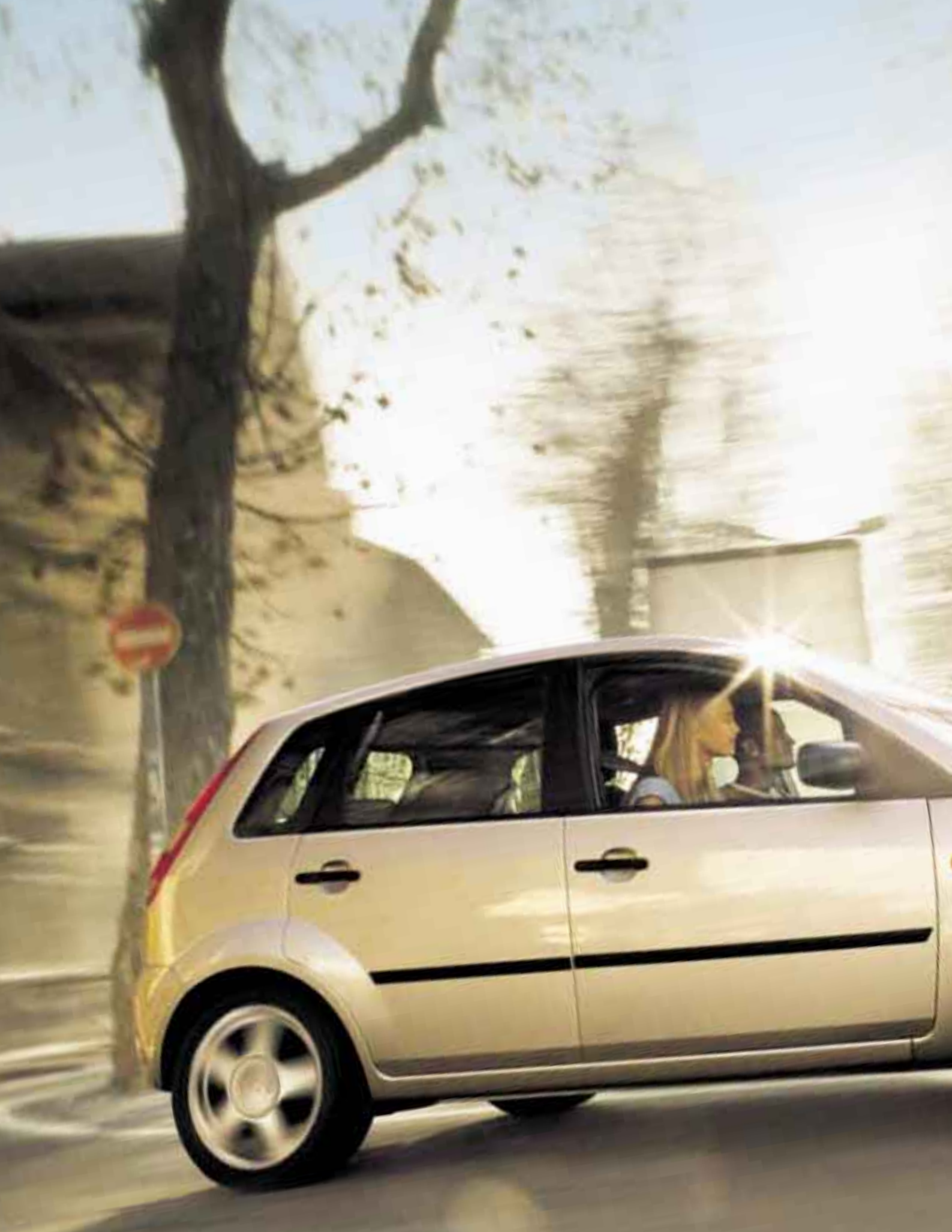
4 Modello Zetec Colore Moondust Silver Accessori (a costo aggiuntivo) vernice metallizzata, cerchi in lega da 15" a 5 razze