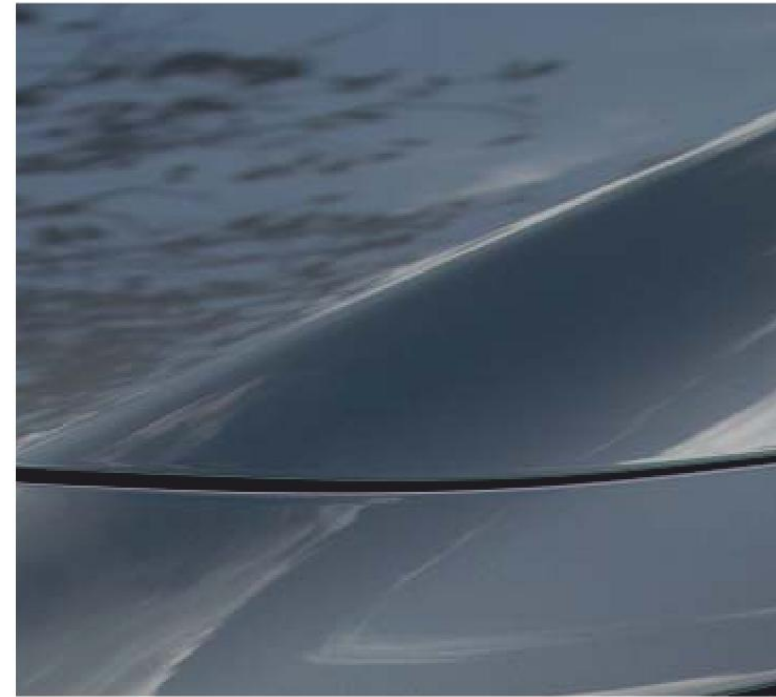
Machine Gray Metallic

Visita il nostro sito mazda.it per vedere tutti i luminosi colori disponibili da scegliere.