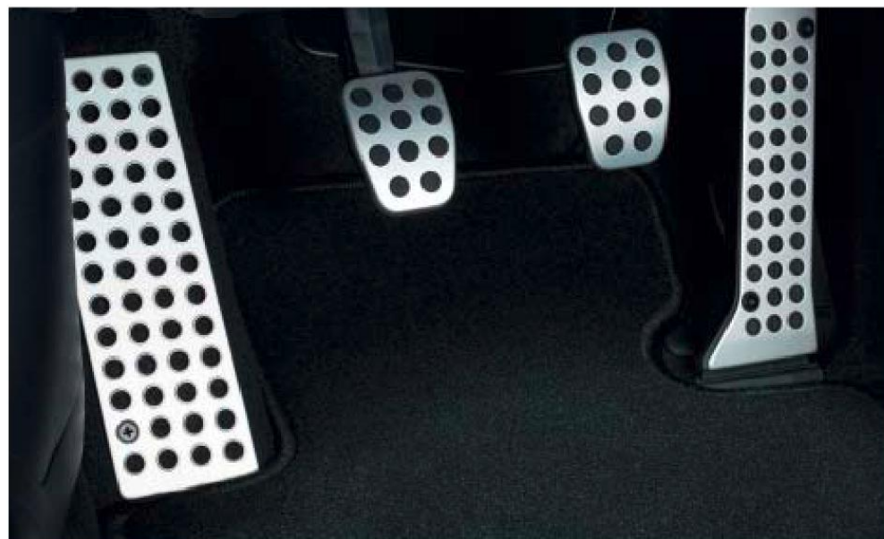
Pedaliera in alluminio