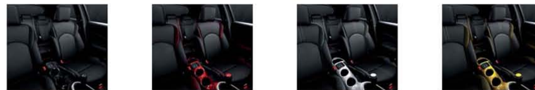
NERO TOKYO ROSSO DETROIT BIANCO LONDRA GIALLO SAN DIEGO