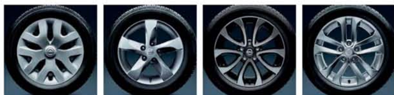
Copri ruota da 16" Cerchi in lega Casual da 16" Cerchi in lega Shiro da 17" Cerchi in lega Sport da 17"