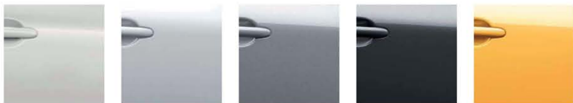
Pearl White - QAB Solid White - 326 Silver Grey - KY0 Dark Metallic Grey - KAD Sunlight Yellow - EAV