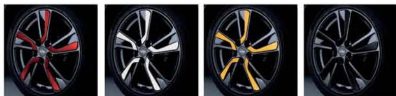
Personalizzazione cerchi in lega da 18" in rosso Detroit, bianco Londra, giallo San Diego, nero Tokyo