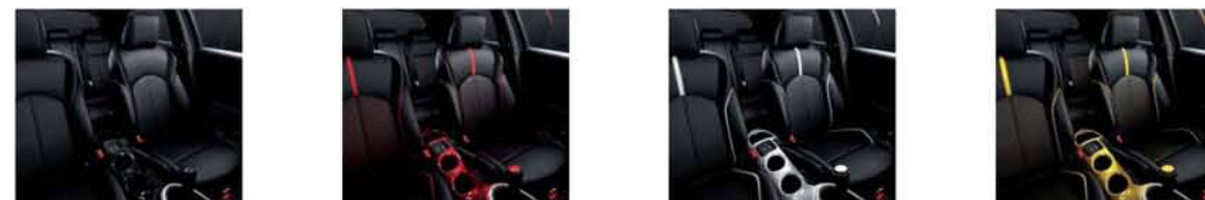
NERO TOKYO ROSSO DETROIT BIANCO LONDRA GIALLO SAN DIEGO

*Rivestimento in ecopelle per la parte posteriore dello schienale e i fianchi dei sedili.