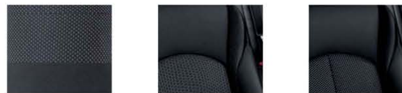
GRIGIO in tessuto GRIGIO in tessuto Premium GRIGIO in pelle* Premium