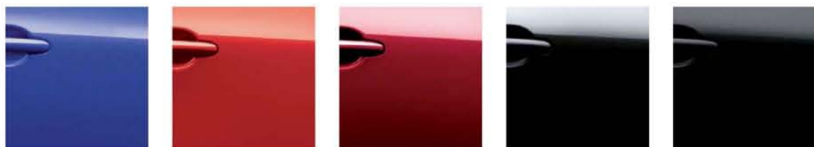
Ink Blue - RBN Solid Red - Z10 Magnetic Red - NAJ Garnet Black - GAC Black Metallic - Z11