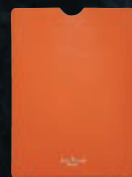
Custodia per tablet in pelle arancione