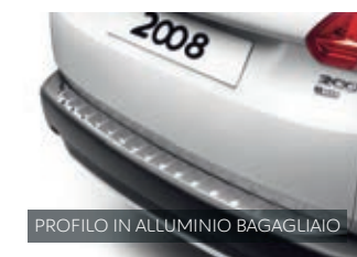
PROFILO IN ALLUMINIO BAGAGLIAIO