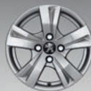
Cerchi in lega 15" Draco