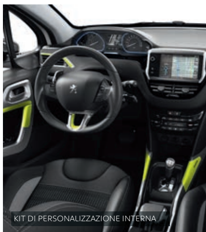
KIT DI PERSONALIZZAZIONE INTERNA