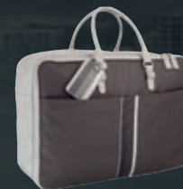
Borsa in pelle grigio perla e Tep marrone