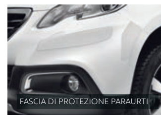
FASCIA DI PROTEZIONE PARAURTI