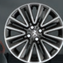
Copricerchi 16" Silicio (2)