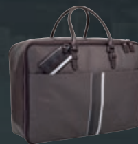
Borsa in pelle marrone e Tep marrone