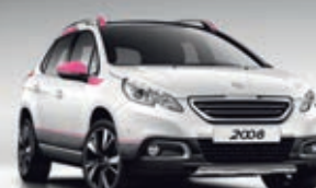
KIT DI PERSONALIZZAZIONE ESTERNA DOWNTOWN FLASH PINK