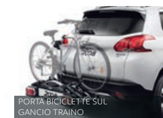
PORTA BICICLETTE SUL GANCIO TRAINO