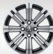
Cerchi in lega 16" Cetus