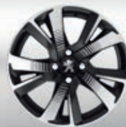
Cerchi in lega 17" Pyxis