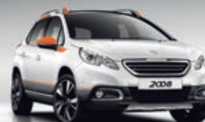
KIT DI PERSONALIZZAZIONE ESTERNA DOWNTOWN ORANGE