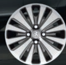
Copricerchi 16" Selenio (3)