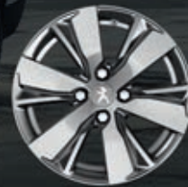
Cerchi in lega 16" Hydre Grigio Dillium