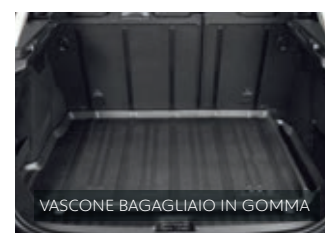
VASCONE BAGAGLIAIO IN GOMMA