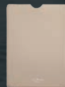
Custodia per tablet in pelle grigio perla