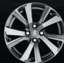
Cerchi in lega 17" Heridan Anthra Mat (4)