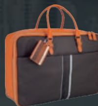
Borsa in pelle arancione e Tep marrone

Scoprite la linea di stile 2008 che vi accompagna con eleganza durante i vostri spostamenti.