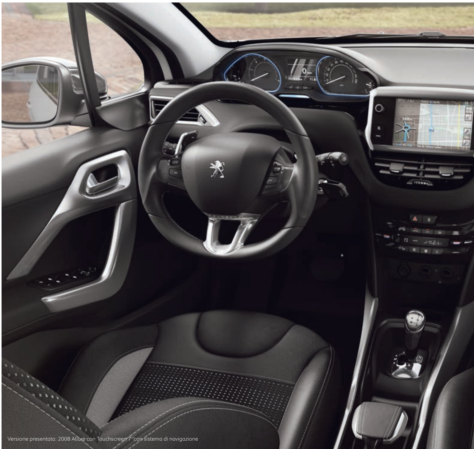
Versione presentata: 2008 Allure con Touchscreen 7" con sistema di navigazione