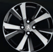
Cerchi in lega 17" Heridan Nero Brillante (4)