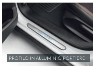
PROFILO IN ALLUMINIO PORTIERE