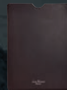
Custodia per tablet in pelle marrone