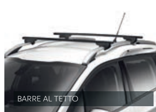
BARRE AL TETTO