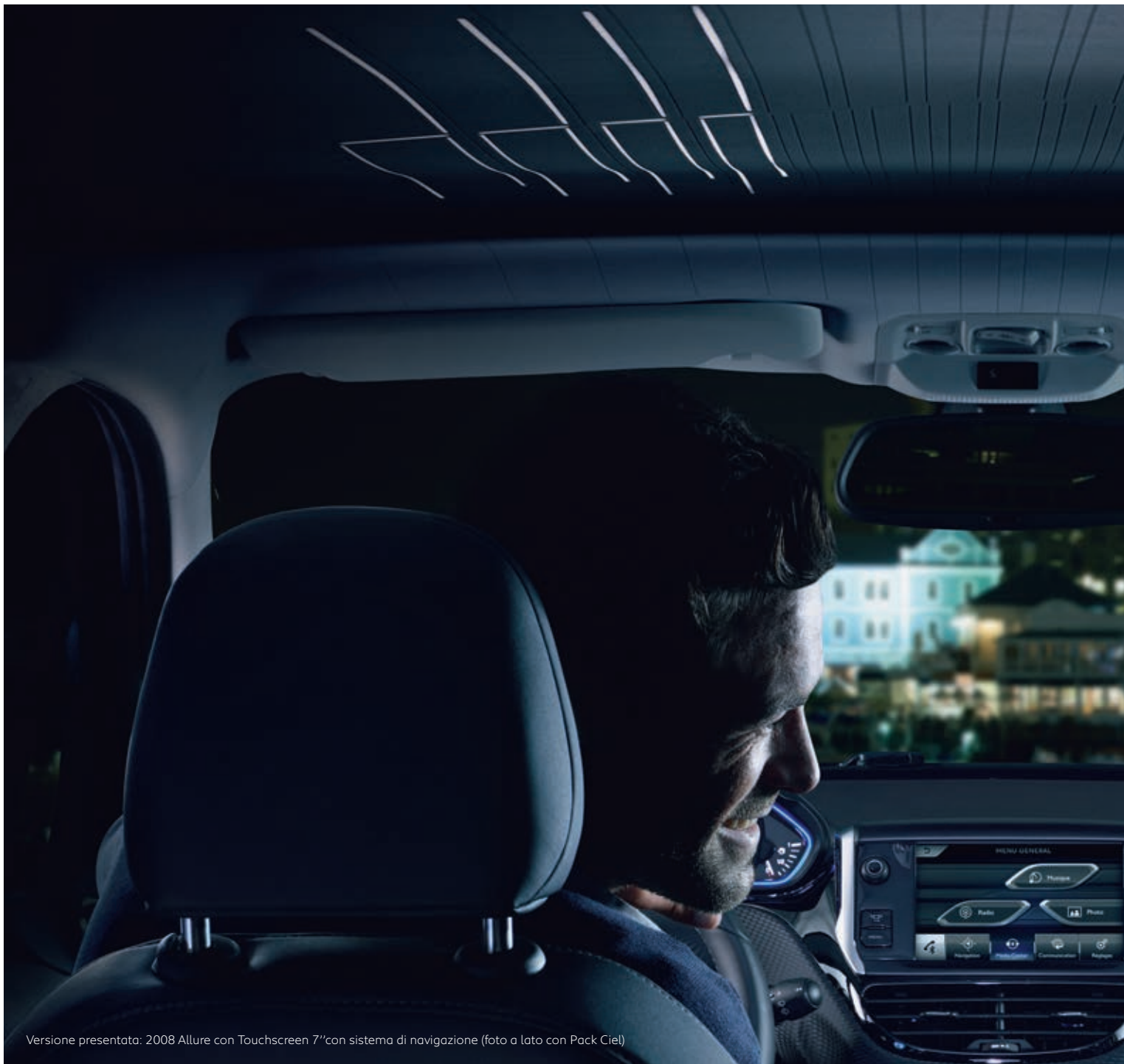
Versione presentata: 2008 Allure con Touchscreen 7" con sistema di navigazione (foto a lato con Pack Ciel)