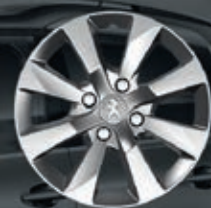
Copricerchi 15" Iode (1)