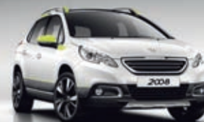
KIT DI PERSONALIZZAZIONE ESTERNA DOWNTOWN CITRUS