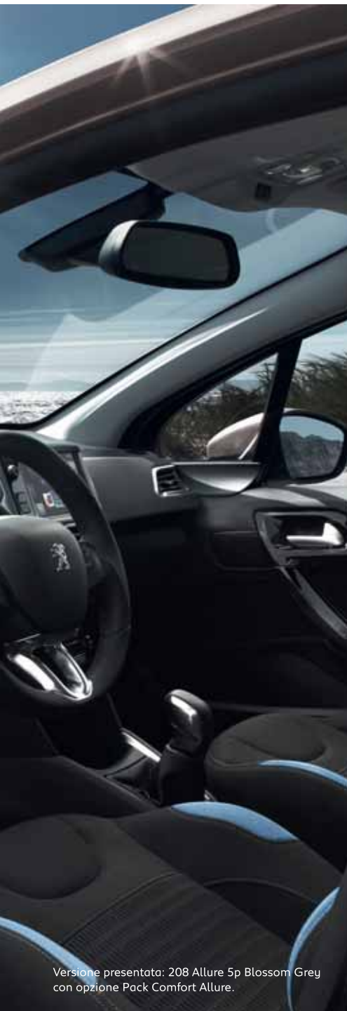
Versione presentata: 208 Allure 5p Blossom Grey con opzione Pack Comfort Allure.