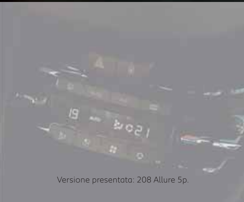
Versione presentata: 208 Allure 5p.