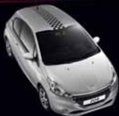
LINEA S SCACCHIERA