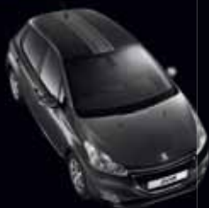
LINEA S BANDE