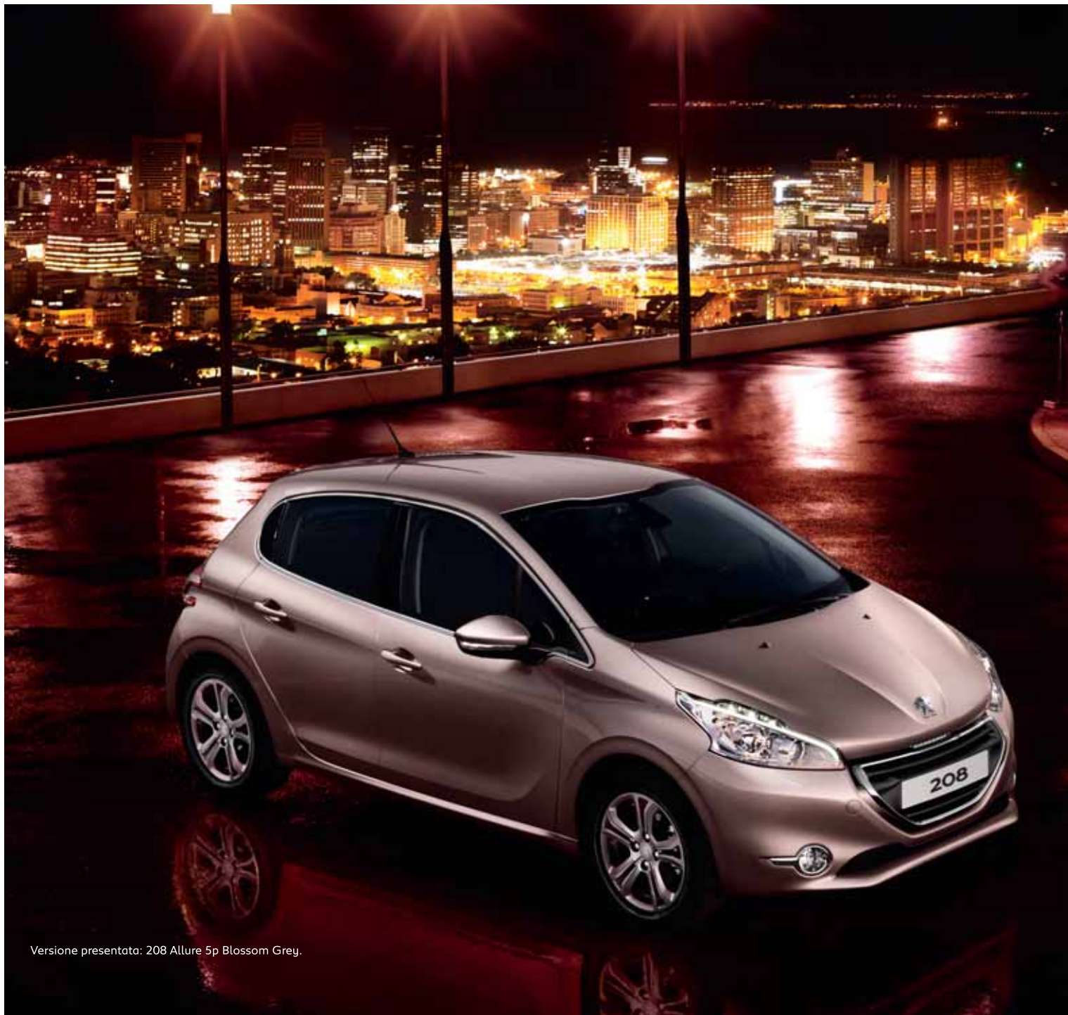
Versione presentata: 208 Allure 5p Blossom Grey.