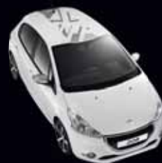
STREET GRIGIO SIDOBRE