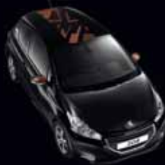
STREET BRUN CALERN