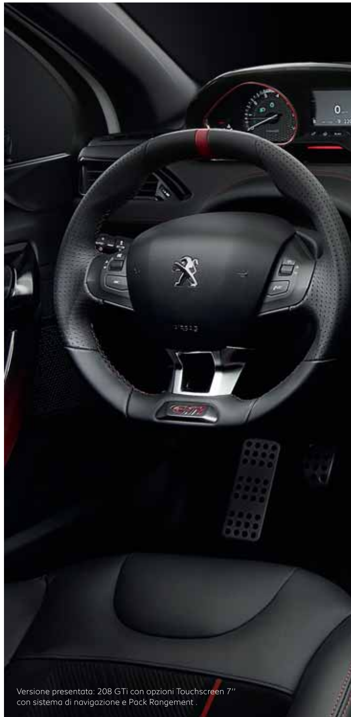
Versione presentata: 208 GTI con opzioni Touchscreen 7" con sistema di navigazione e Pack Rangement .