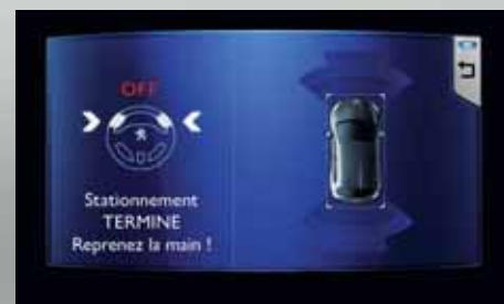
Visuali a titolo indicativo.