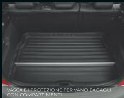
VASCA DI PROTEZIONE PER VANO BAGAGLI CON COMPARTIMENTI