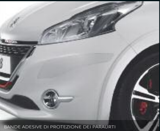
BANDE ADESIVE DI PROTEZIONE DEI PARAURTI