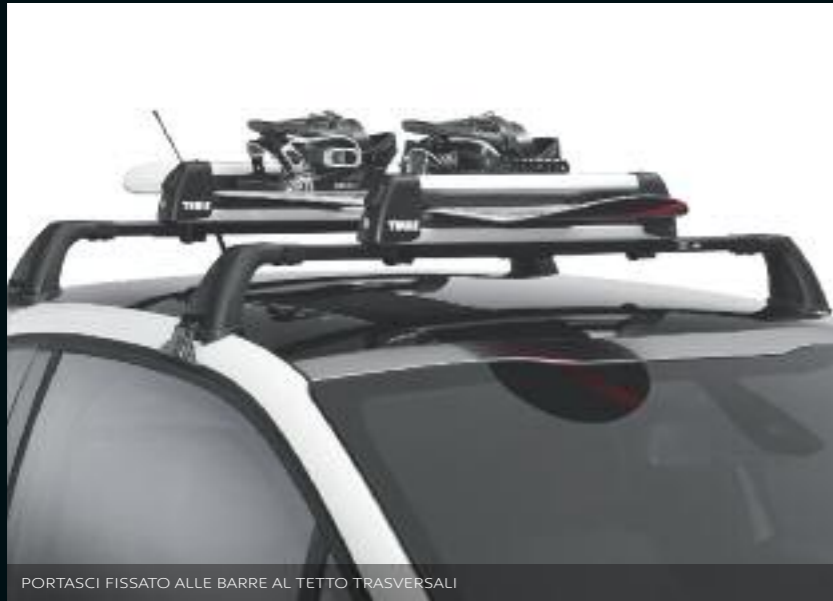
PORTASCI FISSATO ALLE BARRE AL TETTO TRASVERSALI