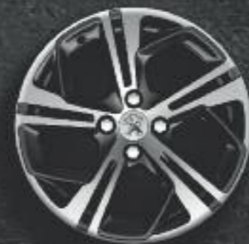
Cerchi in lega 17" Carbone nero Onyx (in opzione)