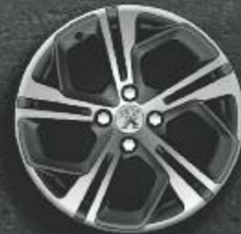
Cerchi in lega 17" Carbone grigio Storm (di serie)