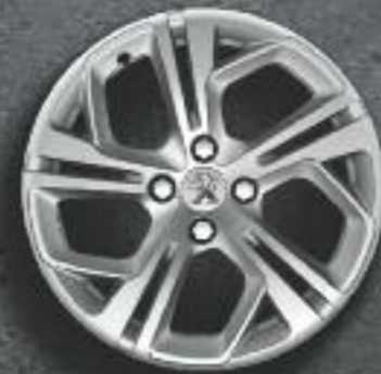
Cerchi in lega 17" Carbone grigio Etincelle (in opzione)

Versione presentata: 208 GTi Grigio Shark con le opzioni Tetto Ciel panoramico in cristallo e Sticker "Scacchiera"