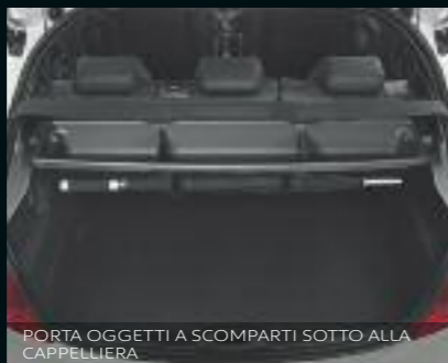
PORTA OGGETTI A SCOMPARTI SOTTO ALLA CAPPELLIERA