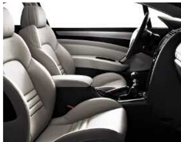
Pelle* Lama (modello presentato con opzione Pelle Integrale**)