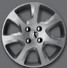
Copricerchi da 16" HAUMEA*