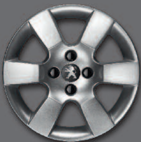
Cerchi in lega da 16" ERIS*