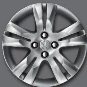
Cerchi in lega da 17" QUARK*