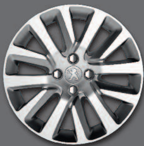
Cerchi in lega da 17" CALLISTO*