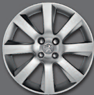
Cerchi in lega da 18" IXION*

* Di serie, in opzione o non disponibile secondo le versioni