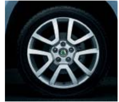
Cerchi in lega 7.0J x 17" SPITZBERG per pneumatici 225/50 R17.