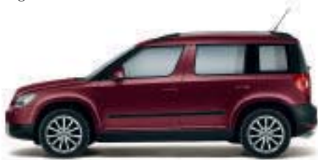
Rosso Brunello metallizzato - X7X7