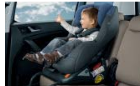
Seggiolino per bambini ISOFIX G 0/1 per garantire anche ai passeggeri più piccoli la massima sicurezza di viaggio.

Gli Accessori Originali Škoda ampliano la gamma degli optional. A seconda dei vostri desideri ed esigenze, Škoda vi offre la possibilità di scegliere tra numerosi accessori per personalizzare ulteriormente la vostra vettura, aumentandone la praticità d'uso, il comfort di viaggio o la capacità di trasporto. La gamma di Accessori Originali Škoda comprende modanature, cerchi in lega, prodotti in pelle, tappetini, radio e sistemi di navigazione, guide per il tetto, seggiolini per bambini e molto altro ancora. È disponibile anche un tenero peluche Yeti . Per una panoramica completa della gamma prodotti, è possibile richiedere ai Partner Škoda il catalogo Accessori Originali.