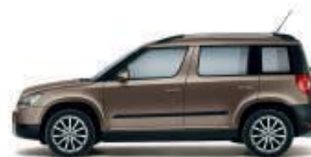
Marrone Mato metallizzato - 1M1M