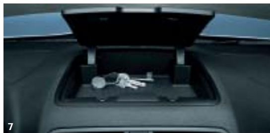
7. Vano portaoggetti con chiusura nella plancia.