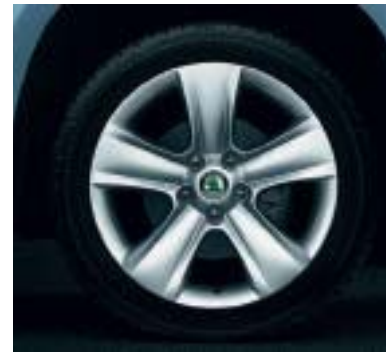
Cerchi in lega 7.0J x 17" DOLOMITE per pneumatici 225/50 R17.