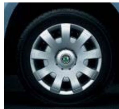
Cerchi in acciaio 16" 7.0J, per pneumatici 215/60 R16 con copricerchio RIF .