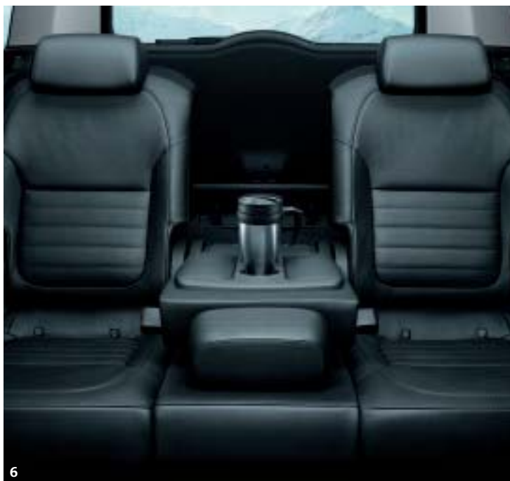
6. Tavolinetto richiudibile nello schienale posteriore centrale.