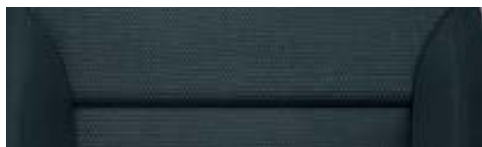
Interni Reflex – Active Onyx/Onyx