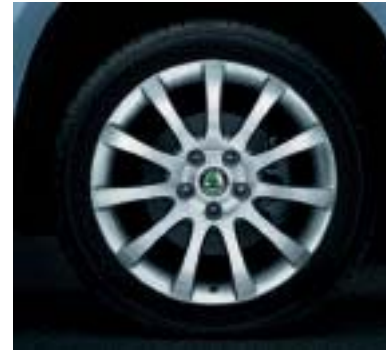
Cerchi in lega 7.0J x 17" ANNAPURNA per pneumatici 225/50 R17.