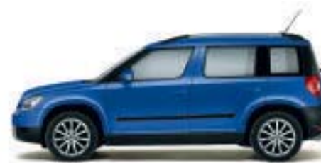
Blu Pacifico - Z5Z5