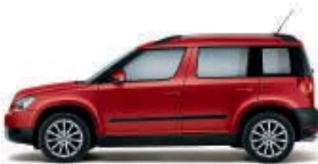
Rosso Corallo - 8T8T