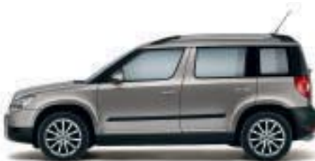
Beige Cappuccino metallizzato - 4K4K