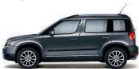
Grigio Fumo metallizzato* - 9J9J