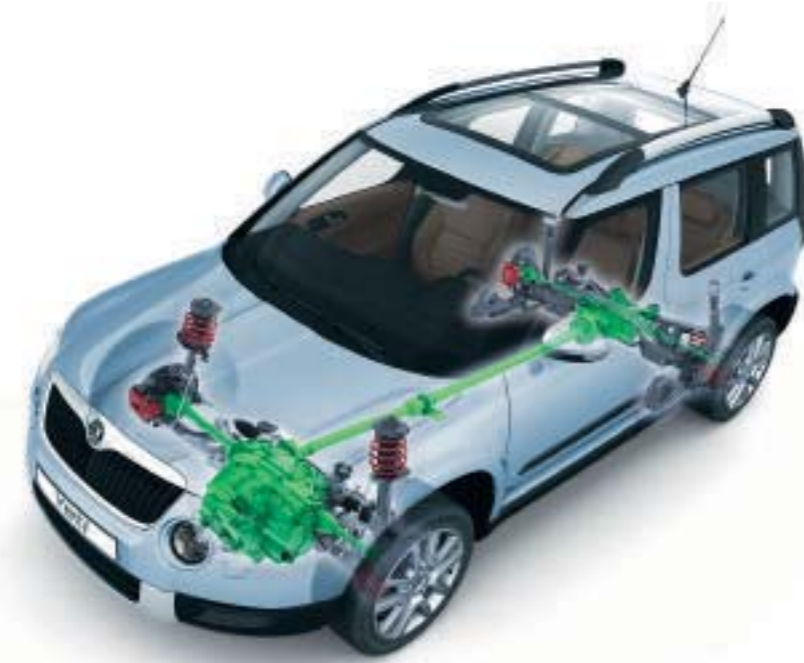
Škoda Yeti con trazione 4x4 e frizione Haldex di quarta generazione (motori 1.8 TSI 118 kW / 160 CV e 2.0 TDI CR FAP 81 kW / 110 CV; 103 kW / 140 CV e 125 kW / 170 CV)