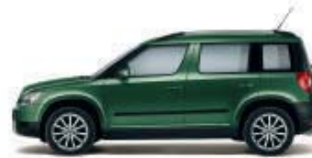
Verde Amazzonia metallizzato - 7R7R