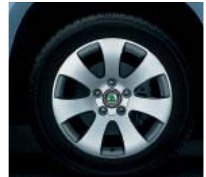
Cerchi in lega 7.0J x 16" SPECTRUM per pneumatici 215/60 R16.