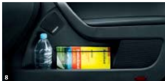
8. Portabottiglie da 1 litro integrati nei vani delle portiere anteriori.