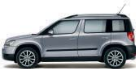
Grigio Platino metallizzato - 2G2G