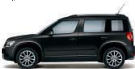
Nero Tulipano perlato - 1Z1Z