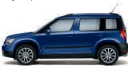
Blu Zaffiro metallizzato - 8D8D