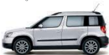
Argento Brillante metallizzato - 8E8E