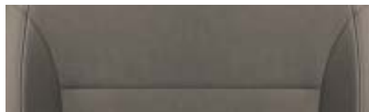
Interni Antilope – Adventure ed Experience Alcantara Sabbia Gobi/pelle/simil-pelle