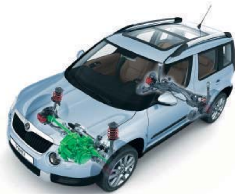
Škoda Yeti con trazione anteriore (motori 1.2 TSI 77 kW / 105 CV e 2.0 TDI CR FAP 81 kW / 110 CV)