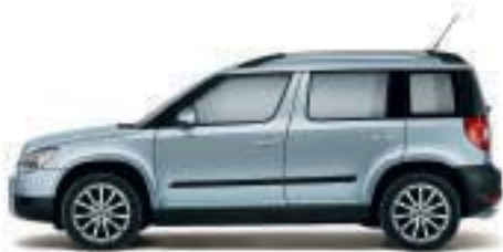
Blu Acqua metallizzato - 3U3U