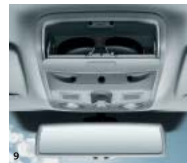
9. Vano portaocchiali.