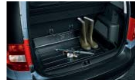
Vasca bagagliaio in plastica a bordo sollevato di 15 cm.