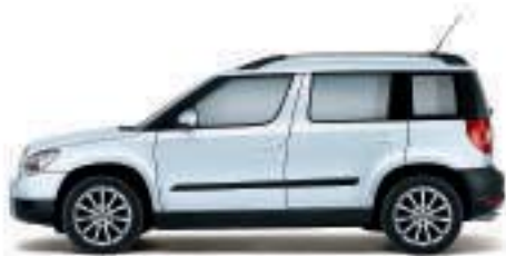
Bianco Magnolia - 9P9P