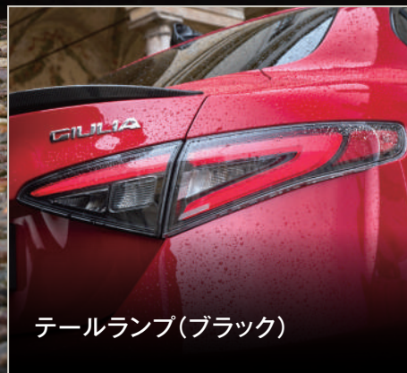
テールランプ(ブラック)