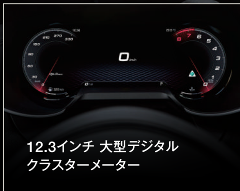
12.3インチ 大型デジタル クラスターメーター