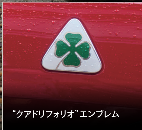
“クアドリフォリオ”エンブレム