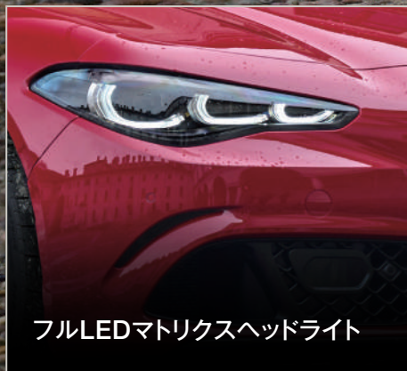
フルLEDマトリクスヘッドライト