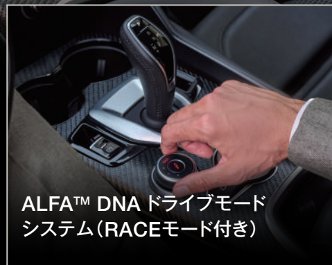
ALFA™ DNAドライブモード システム(RACEモード付き)