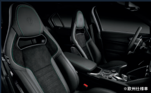
スパルコ社製 カーボンバケットシート