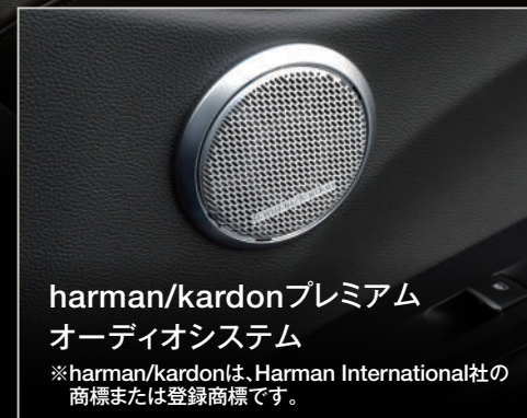
harman/kardonプレミアム オーディオシステム

※harman/kardonは、Harman International社の 商標または登録商標です。