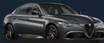
ヴェズヴィオ グレー