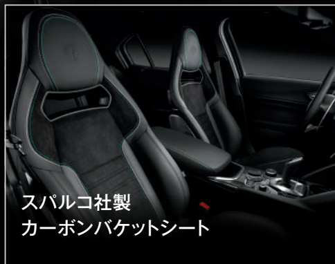
スパルコ社製 カーボンバケットシート

ジュリア クアドリフォリオは、新たに採用された3D仕上げのカーボンファイバーで装飾され、レーシングマシンにインスパイアされた各種装備を備えています。ステアリングホイールには、アルミ製シフトパドルとコントロールスイッチが備わり、ドライバーとの高い一体感を実現。また、スパルコ社製カーボンバケットシートはカーボンファイバー・レザー・アルカンターラを使用し、最高レベルの快適さと、スポーツドライブに集中できるホールド性を提供します。