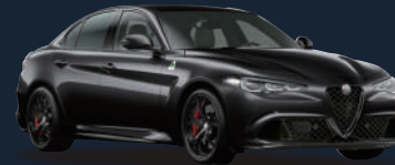
ブルカノ ブラック