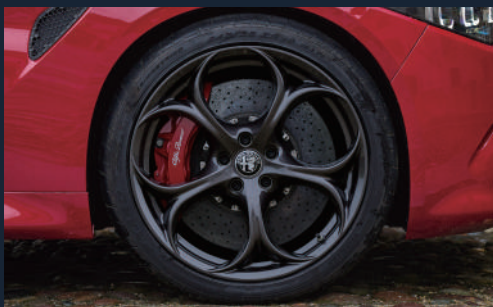
19インチ 5ホールデザイン アルミホイール