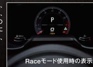
Raceモード使用時の表示

トラクションコントロールの介入は限定的となり、ステアリング、アダプティブクルーズコントロール、ブレーキ、サスペンションがサーキット対応の設定に。合わせて、エキゾーストシステムはさらにダイナミックな設定となり、轟くサウンドとともに、究極のドライビングエクスペリエンスを実現します。