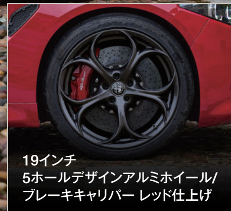
19インチ 5ホールデザインアルミホイール/ ブレーキキャリパー レッド仕上げ

※掲載の写真は欧州仕様車です。一部日本仕様と異なる場合があります。※日本仕様車は右ハンドルとなります。