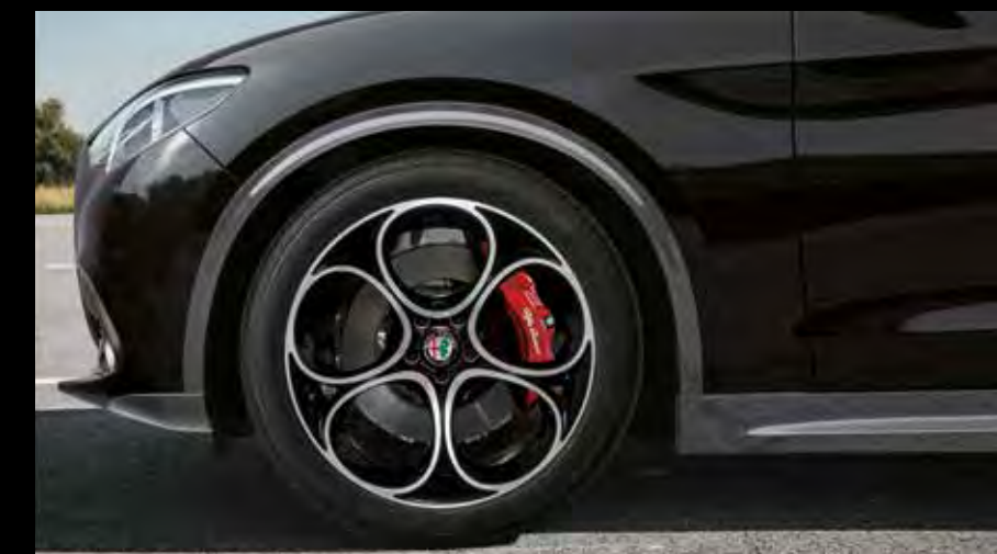
20インチ 5ホールデザイン アルミホイール