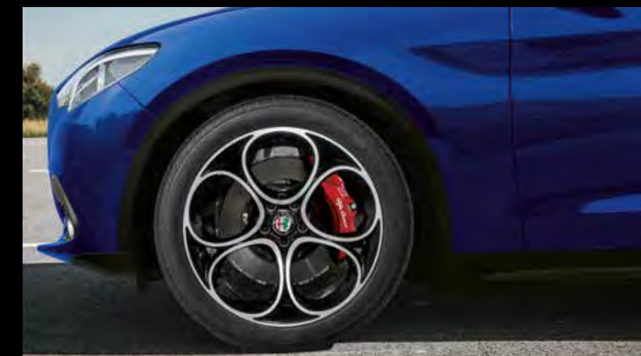
20インチ 5ホールデザイン アルミホイール