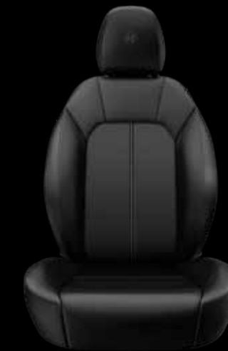
ナチュラルレザーシート (ブラック)