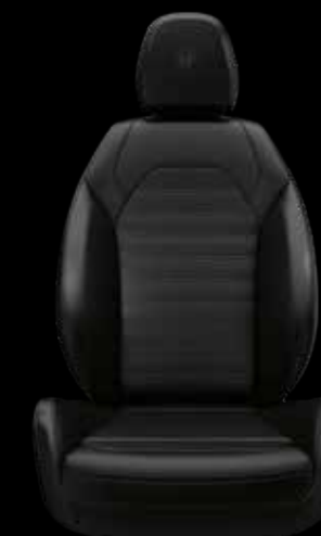
スポーツレザーシート (ブラック)