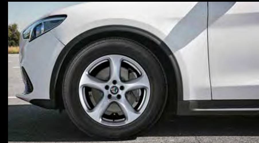
18インチ 5スポークデザイン アルミホイール