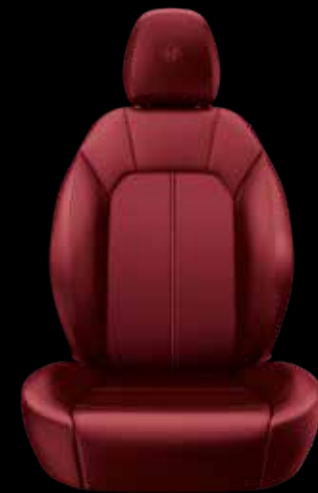
ナチュラルレザーシート (レッド)