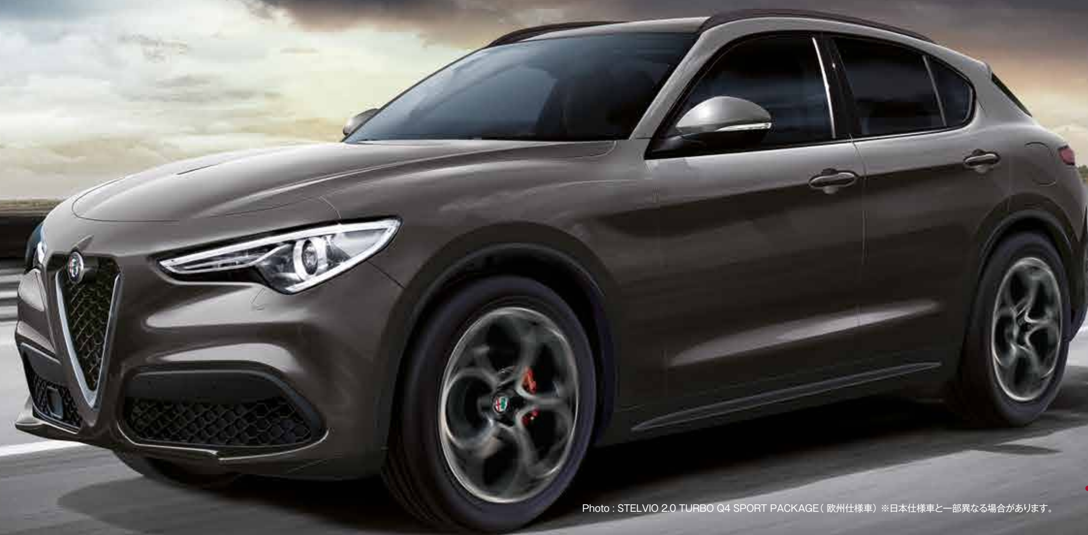
Photo : STELVIO 2.0 TURBO Q4 SPORT PACKAGE (欧州仕様車) ※日本仕様車と一部異なる場合があります。

抜群の燃費性能と最高出力210PS/最大トルク470Nmを誇る4輪駆動の2.2Lディーゼルエンジンも、ZF社製8速オートマチックトランスミッションとの組み合わせ。低回転域からの豊かなトルクと息の長い加速が、余裕のある爽快な走りと優れた高速巡行性能を実現する。