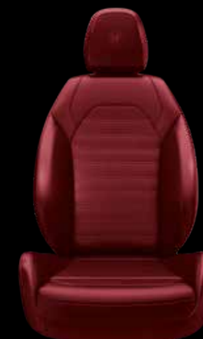
スポーツレザーシート (レッド)