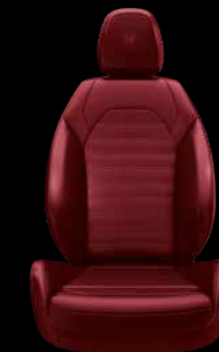
スポーツレザーシート (レッド)