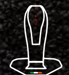
革巻きのシフトレバー

操作性の高さだけでなく、見た目の美しさを兼ね備えた、革巻きのシフトレバーを採用。その豊かな質感で、快適なシフトチェンジを約束する。