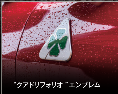
“クアドリフォリオ”エンブレム