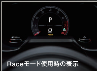
Raceモード使用時の表示

トラクションコントロールの介入は限定的となり、ステアリング、アダプティブクルーズコントロール、ブレーキ、サスペンションがサーキット対応の設定に。合わせて、エキゾーストシステムはさらにダイナミックな設定となり、轟くサウンドとともに、究極のドライビングエクスペリエンスを実現します。