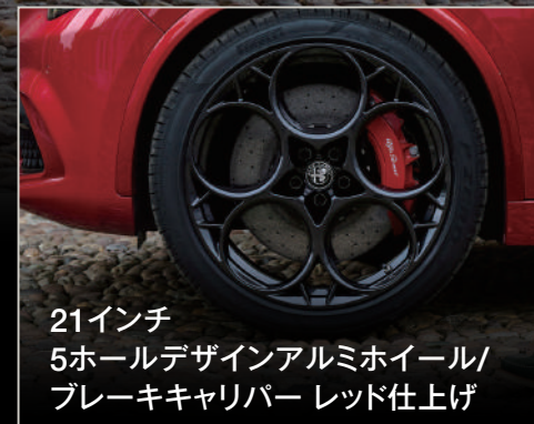
21インチ 5ホールデザインアルミホイール/ ブレーキキャリパー レッド仕上げ