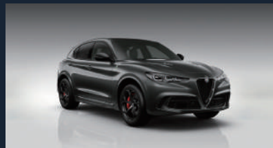
ヴェズヴィオ グレー