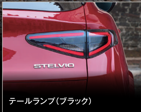
テールランプ(ブラック)