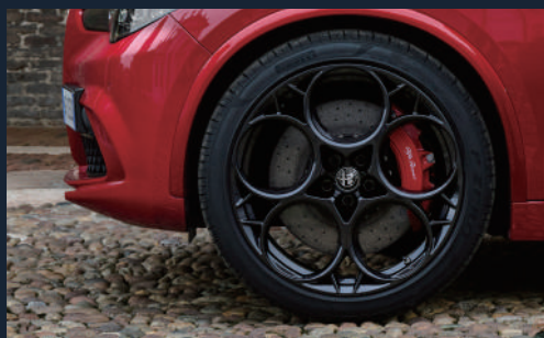
21インチ 5ホールデザイン アルミホイール