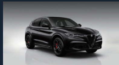
ブルカノ ブラック