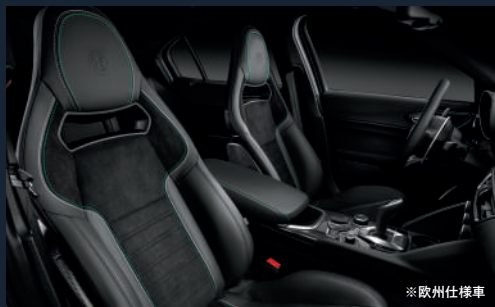
スパルコ社製 カーボンバケットシート