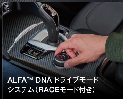
ALFA™ DNA ドライブモード システム (RACEモード付き)