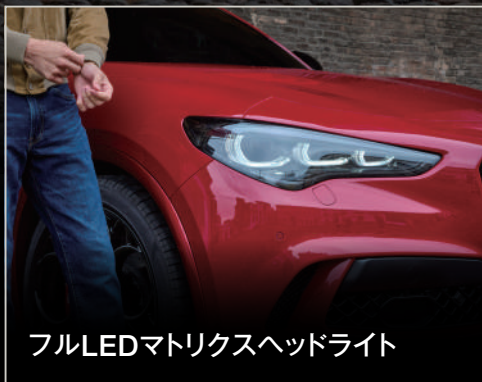
フルLEDマトリクスヘッドライト