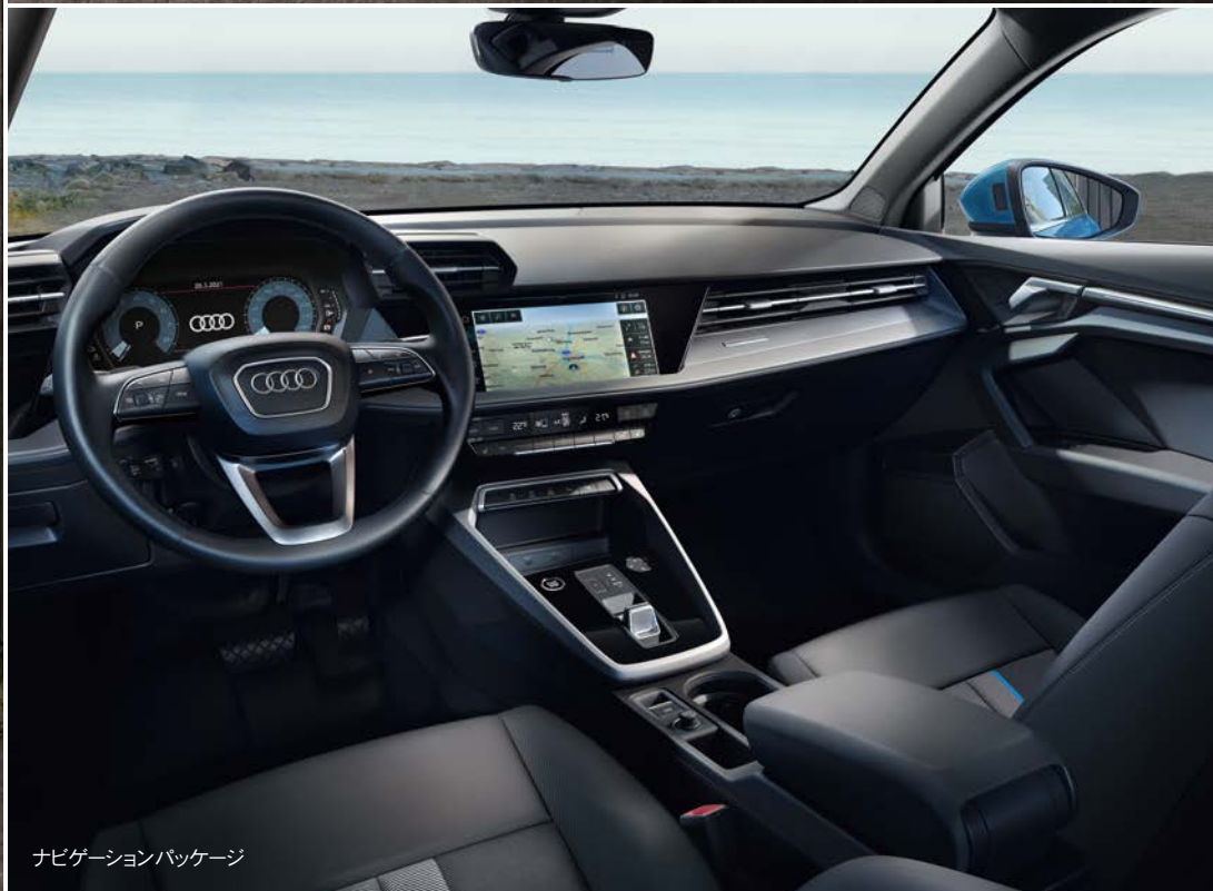
ナビゲーションパッケージ