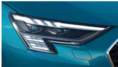
マトリクスLEDヘッドライト ダイナミックターンインディケーター(フロント/リヤ)