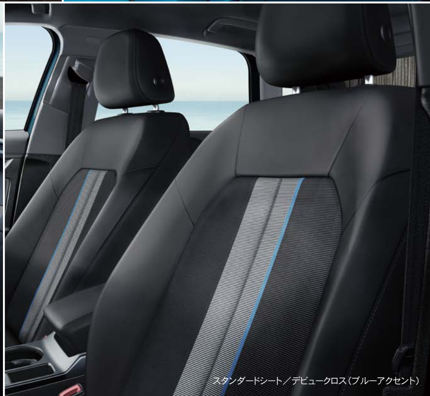
スタンダードシート/デビュークロス(ブルーアクセント)