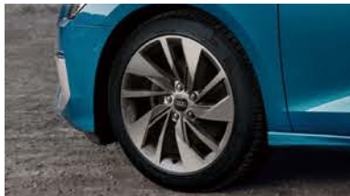
アルミホイール 5スポークVデザイン 8J×18+225/40R18タイヤ