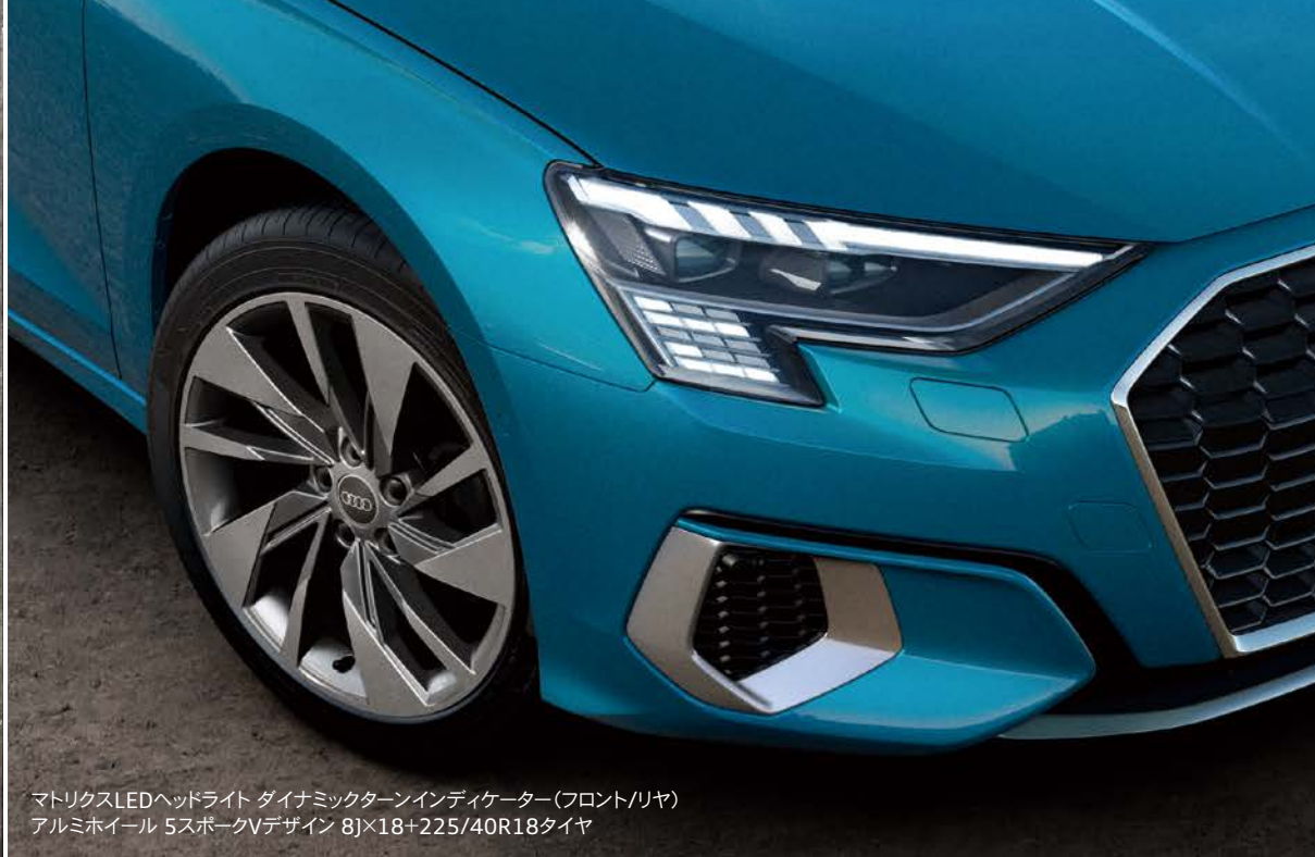
マトリクスLEDヘッドライト ダイナミックターンインディケーター(フロント/リア) アルミホイール 5スポークVデザイン 8J×18+225/40R18タイヤ