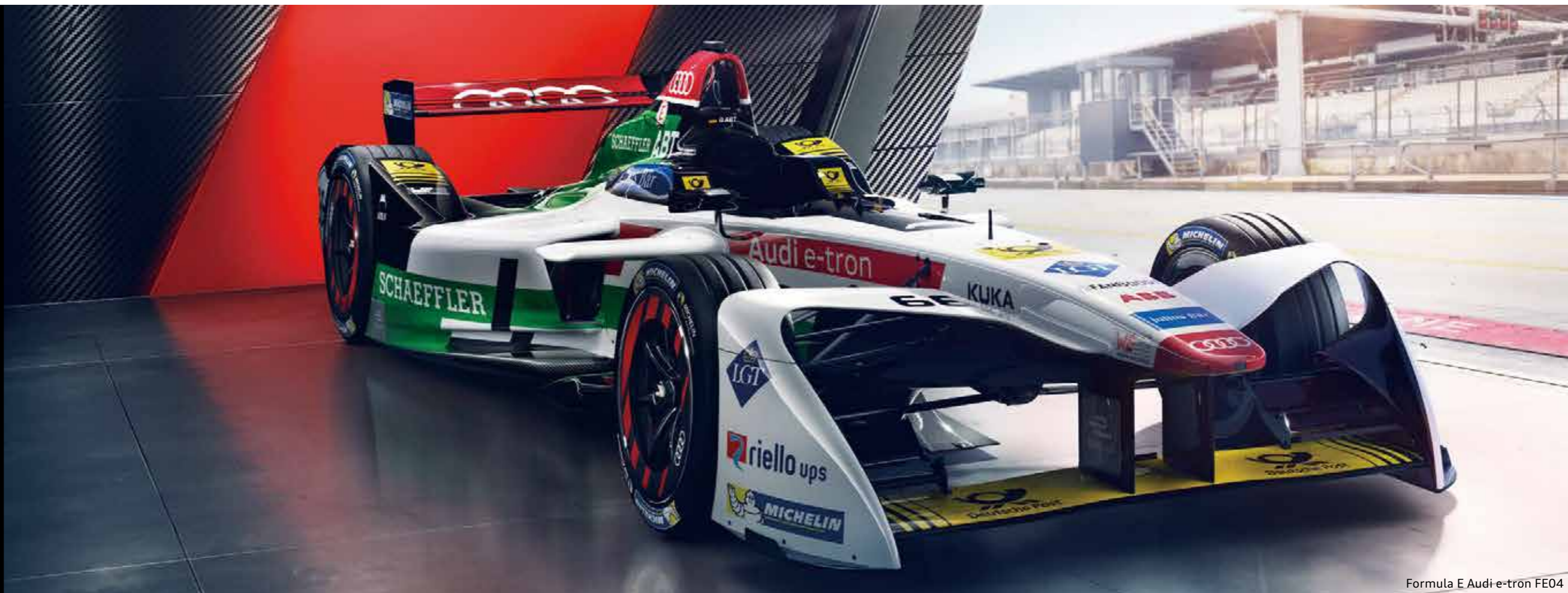
Formula E Audi e-tron FE04

Formula Eで参加初年度チーム優勝。 Audiの創生期から、電気自動車の未来の技術を磨くFormula Eまで。 モータースポーツへの挑戦こそ、進化の原動力。