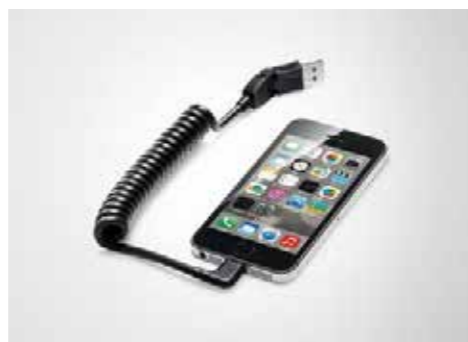
AMI接続アダプター 標準装備のAMIに取り付けて使用するiPhone®/iPod®等のUSB接続アダプター。