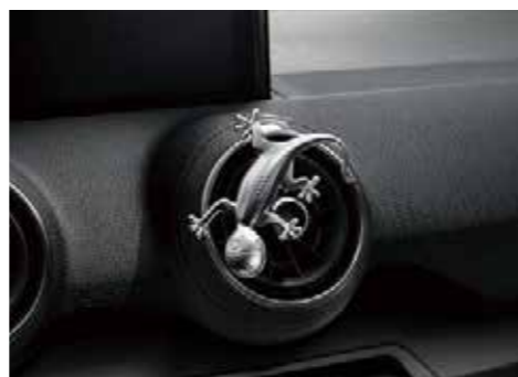
デザインゲッコー アルミ塗装のゲッコーマスコット。エアバントに差し込んだり、マグネットでお好みの場所に固定できます。