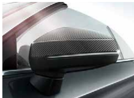
カーボンミラーハウジング 軽量化とスポーティさを演出します。