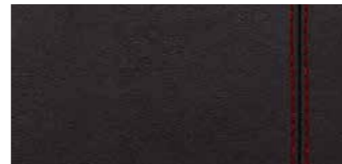
ブラック/クレッシェンドレッド [ファインナッパレザー]