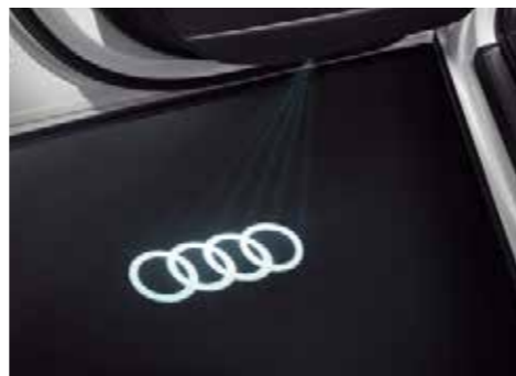
ドアエントリーライト (Audiマーク) ドア開閉時に、足元をAudiマークで照らします。