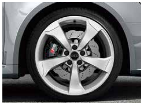
5アームローターデザインアルミホイール 8J-19、インセット49、PCD112mm (RS 3 Sportbackウインタータイヤ用)

Audiの美しいスタイリングや高い実用性をさらに輝かせる、数々の純正アクセサリをご用意いたしました。Audiと過ごす時間をひととき心地よく、さらに自分らしく。あなたにとってこの上なく魅力的なAudiに仕立ててください。