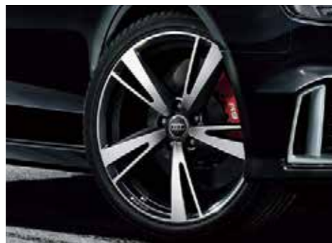
5アームブレッドデザインアルミホイール 8J-19、インセット42、PCD 112mm (RS 3 Sedanウインタータイヤ用)