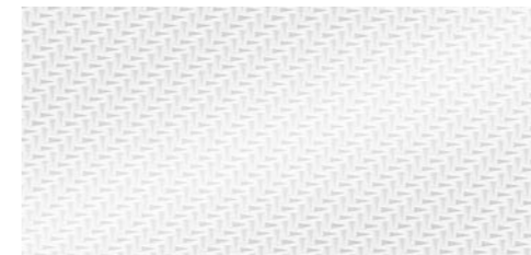
アルミニウムレース