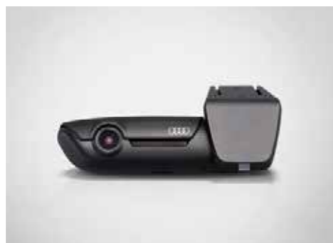
Audi ユニバーサルトラフィックレコーダー Audi専用デザインのドライブレコーダーです。専用アプリにてスマートフォン上で操作できます。レーダー感知作動による駐車監視や、イベントの自動録画、GPSによる自車位置検知など、多機能と高機能を兼ね備えています。フロント用とフロント&リヤ用があります。