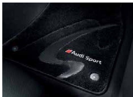
フロアマット(プレミアムスポーツ) 高密度カーペットにリアルカーボンとアルミニウム製のエンブレムを使用。素材には花粉等のアレル物質を吸着し、雑菌の増殖を抑制させる「プレミアムクリーン」を使用した、車内をクリーンに保つ、高品質なフロアカーペットです。 カラー：ブラック