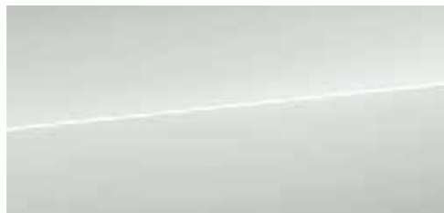
グレイシアホワイト メタリック