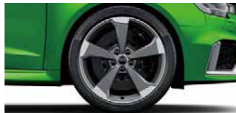
アルミホイール 5アームローターデザイン マットチタンルック 8J×19 +235/35 R19タイヤ [Audi RS 3 Sportbackに標準装備]