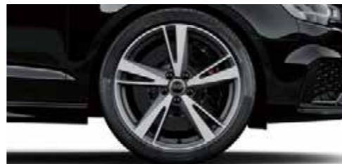
アルミホイール 5アームブレードデザイン マットチタンルック 8J×19 +235/35 R19タイヤ [Audi RS 3 Sedanに標準装備]