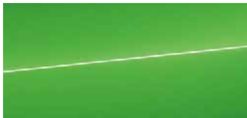
キャラミグリーン