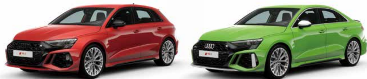
ブラックAudi rings&ブラックスタイリングパッケージ エクステリアミラーハウジング ブラック