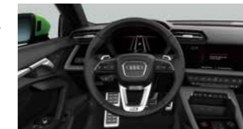
ステアリングホイール 3スポーク レザー マルチファンクション パドルシフト