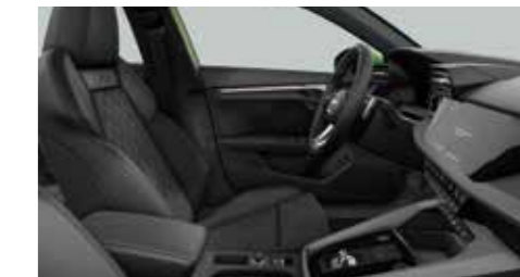
スポーツシート(フロント)/ダイナミカ/アーティフィシャルレザー