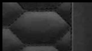
ブラック[ファインナッパレザー ハニカム ステッチング]*