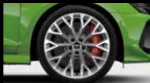
■セラミックブレーキ (フロント)/ カラードブレーキキャリパーレッド*