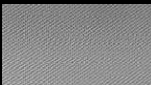
アクセントサーフェス マットカーボンアトラス* ※アクセントサーフェス マットカーボンアトラス 選択時、センターコンソールはハイグロスブ ラックとなります。