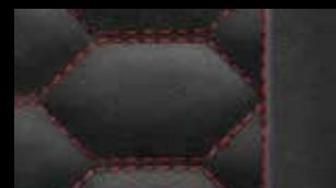
ブラック(エクスプレスレッドステッチ) [ファインナッパレザー ハニカムステッチング]*