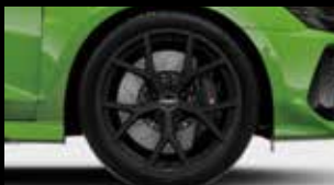
アルミホイール 5スポーク Yデザイン マットブラック (フロント9J×19+265/30 R19タイヤ, リヤ8J×19+245/35 R19タイヤ)*