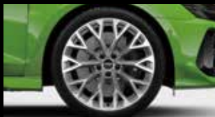
アルミホイール 10スポーク Yデザイン プラチナムグレー (フロント9J×19+265/30 R19タイヤ, リヤ8J×19+245/35 R19タイヤ)