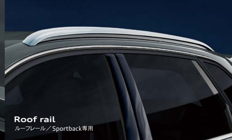
Roof rail ルーフレール / Sportback専用