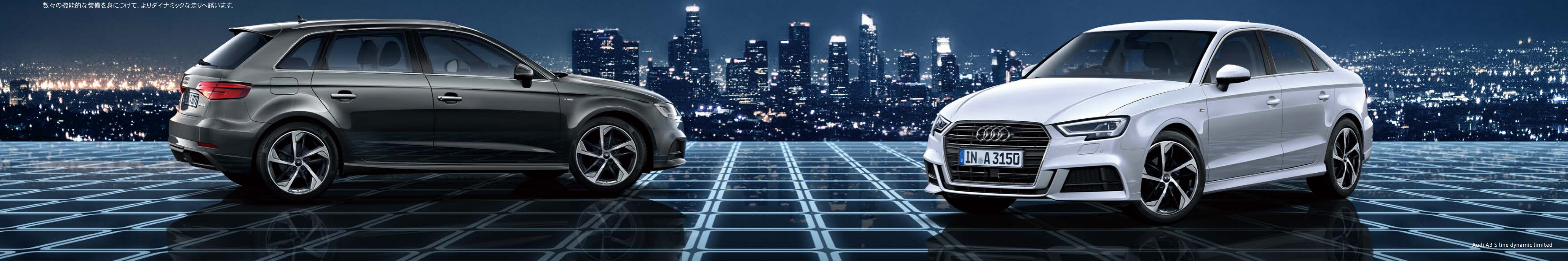
Audi A3 S line dynamic limited