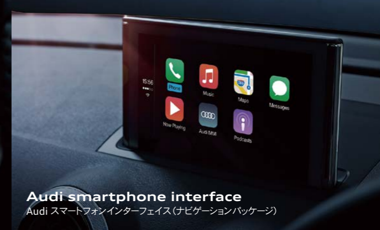
Audi smartphone interface Audi スマートフォンインターフェイス (ナビゲーションパッケージ)