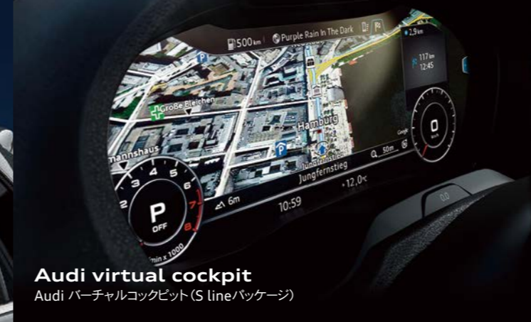
Audi virtual cockpit Audi バーチャルコックピット (S lineパッケージ)