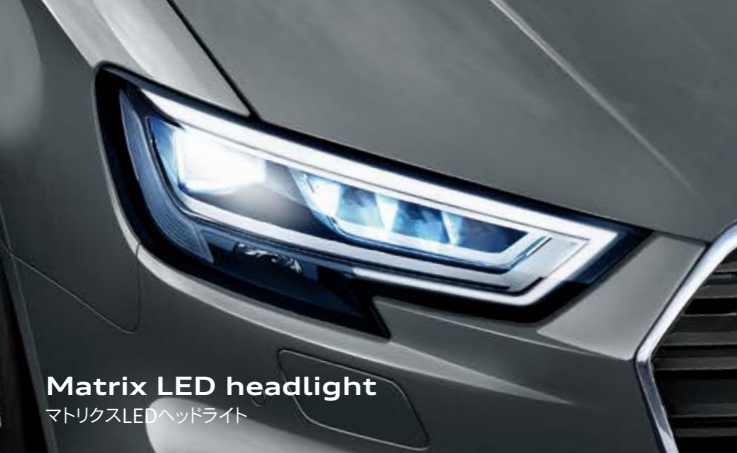
Matrix LED headlight マトリクスLEDヘッドライト