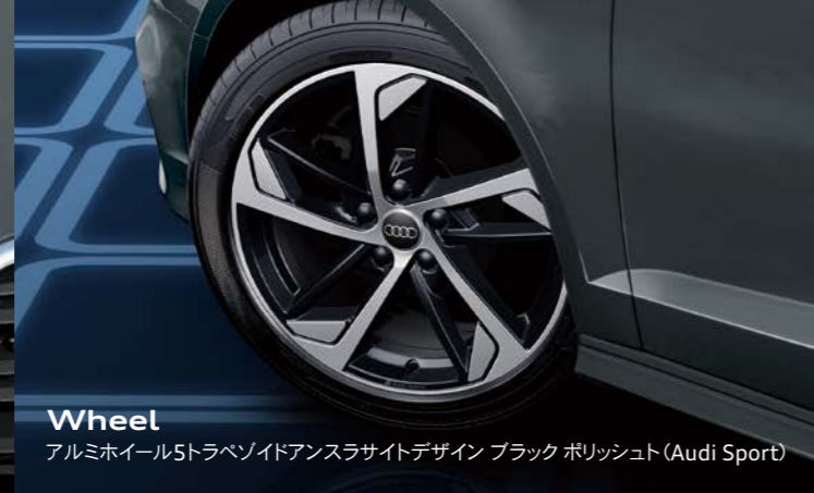
Wheel アルミホイール5トラペゾイドアンスラサイトデザイン ブラック ポリッシュ (Audi Sport)