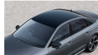
ルーフペイント プリリアントブラック*1