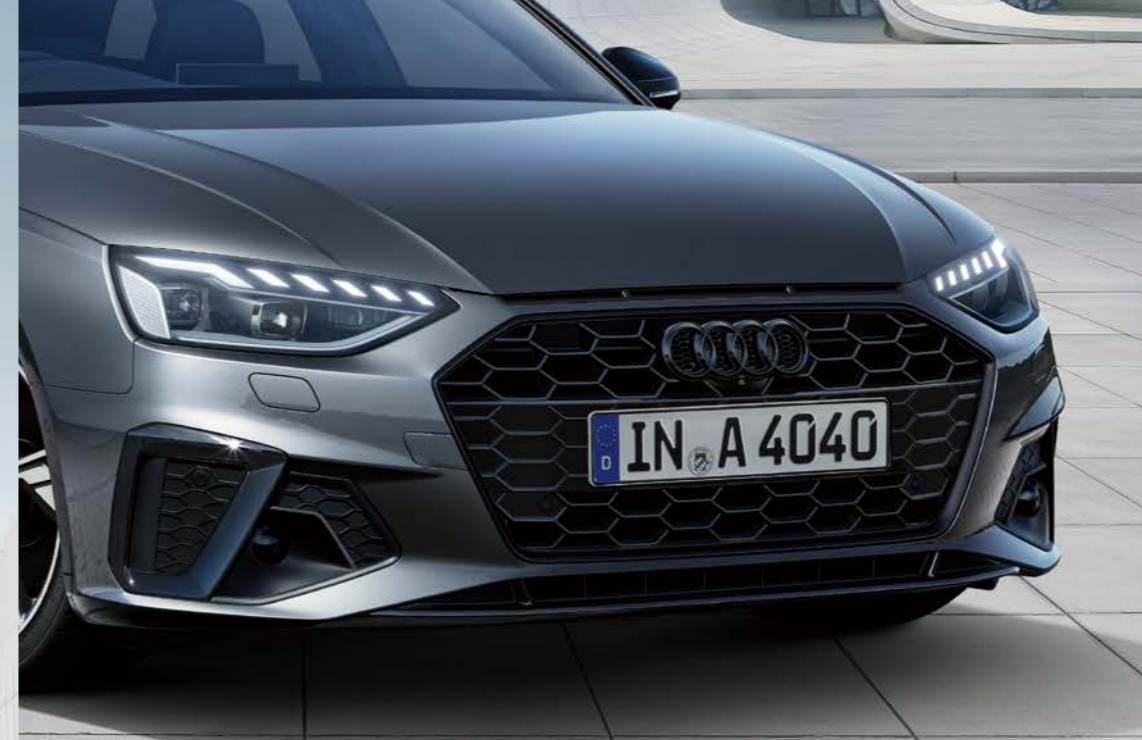
ブラックAudi rings / ブラックスタイリングパッケージ / エクステリアミラーハウジング グロスブラック*