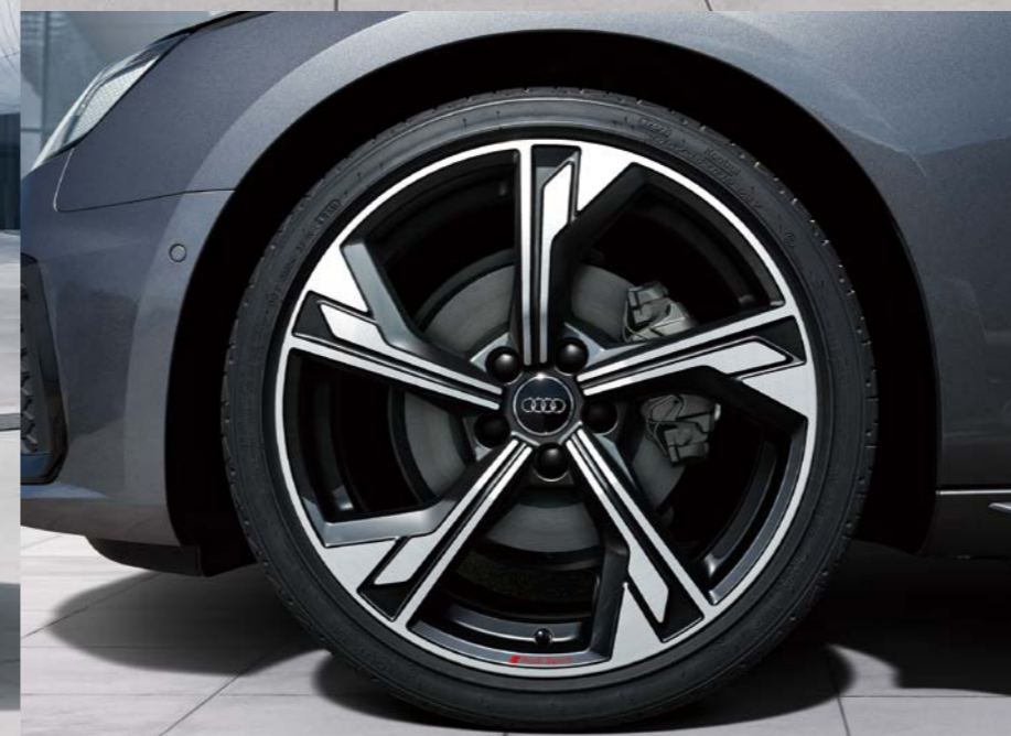
アルミホイール 5アームフラッグデザイン グロスアンスラサイトブラックポリッシュ 8.5J×19 (Audi Sport) +245/35R19タイヤ