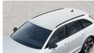
ルーフレール(ブラック)*2