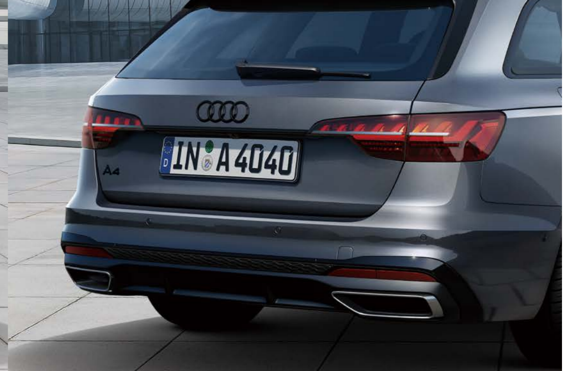
ブラックAudi rings / ブラックスタイリングパッケージ