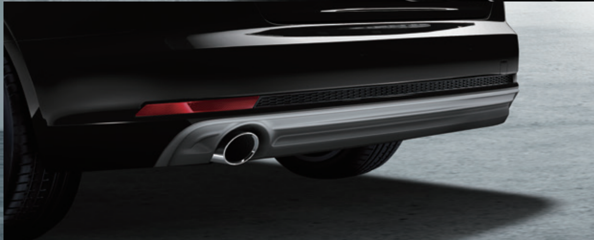
S line エクステリア (リヤバンパー)