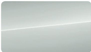
グレイシアホワイト メタリック