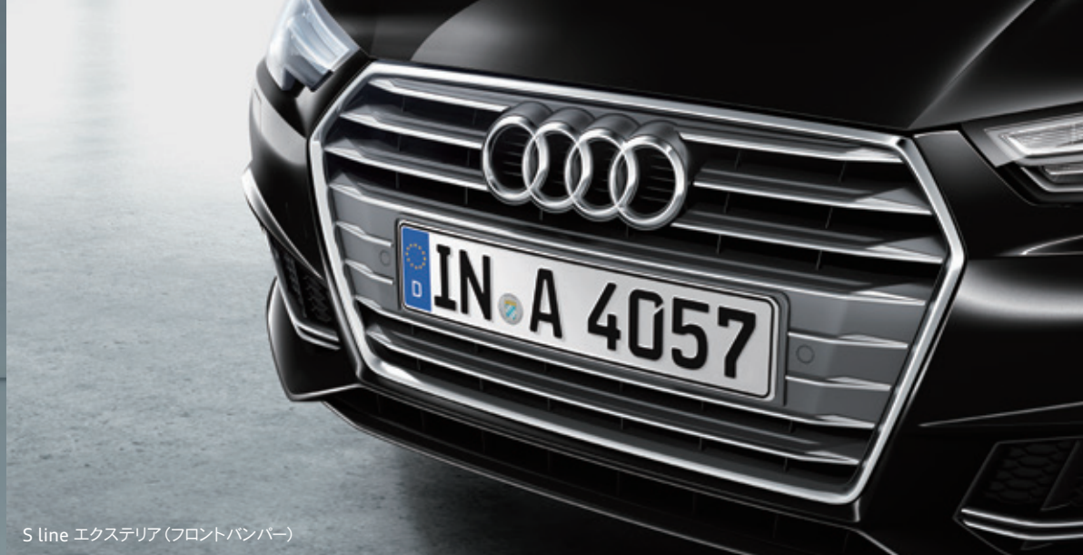
S line エクステリア (フロントバンパー)