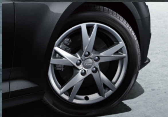
アルミホイール 5スポークYデザイン 7.5J×17