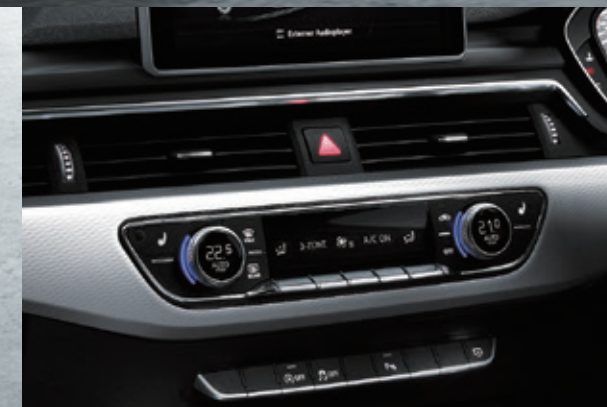
3ゾーンオートマチックエアコンディショナー