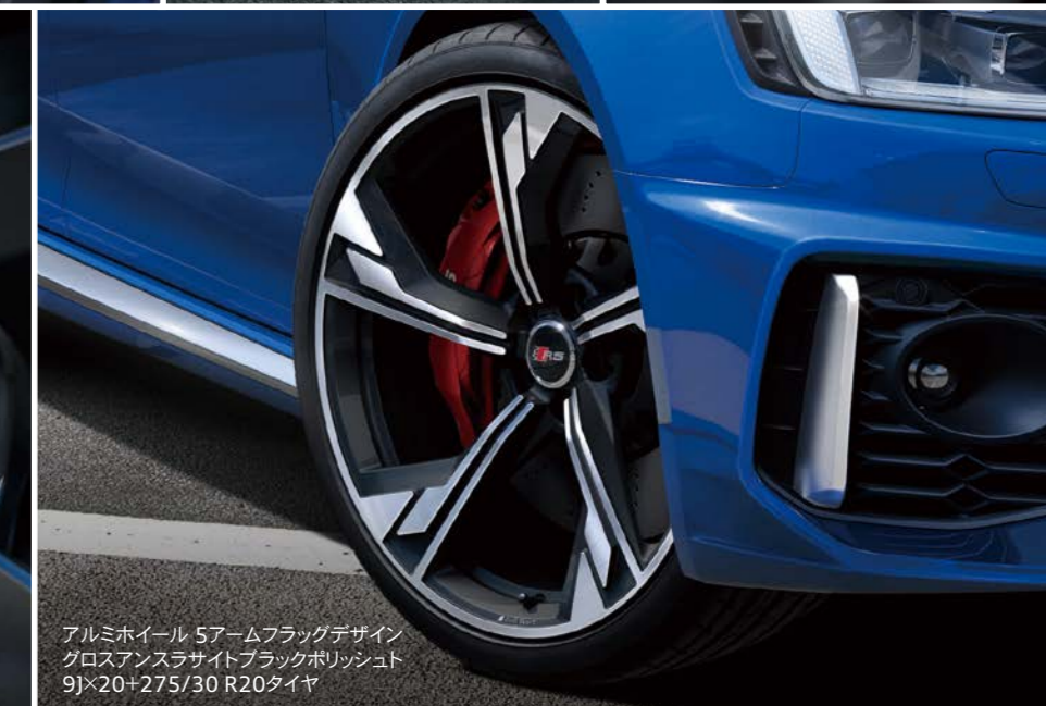
アルミホイール 5アームフラッグデザイン グロスアンスラサイトブラックポリッシュ 9J×20+275/30 R20タイヤ