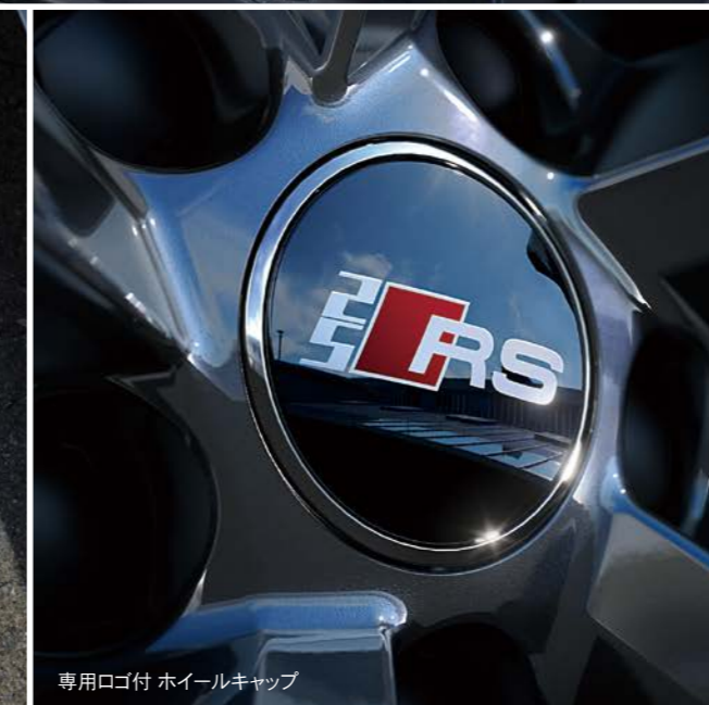
専用ロゴ付 ホイールキャップ