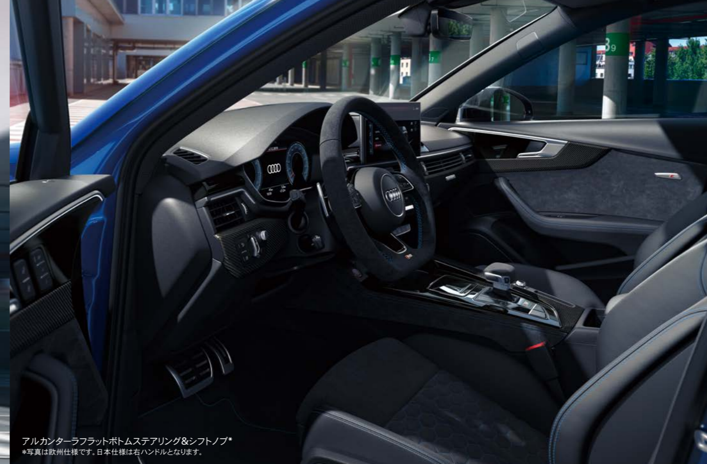
アルカンターラフラットボトムステアリング&シフトノブ *写真は欧州仕様です。日本仕様は右ハンドルとなります。