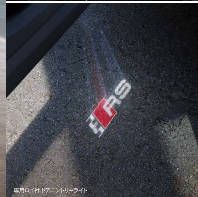
専用ロゴ付 ドアエントリーライト