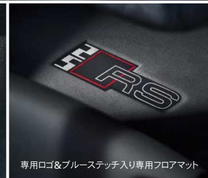
専用ロゴ&ブルーステッチ入り専用フロアマット