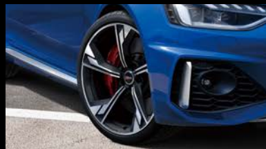
アルミホイール 5アームフラッグデザイン グロスアンスラサイト ブラックポリッシュ 9J×20+275/30 R20タイヤ