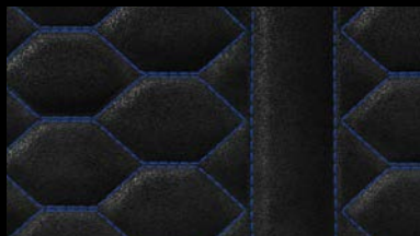
専用ロゴ付 アルカンターラ/レザーシート(ブルーステッチ)