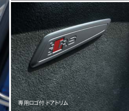
専用ロゴ付 ドアトリム