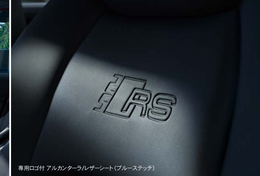
専用ロゴ付 アルカンターラレザーシート (ブルーステッチ)