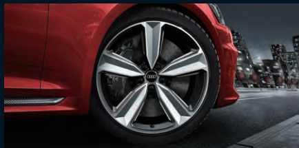
アルミホイール 5アームアンスラサイトデザイン ブラックマット9J×20* +275/30 R20タイヤ * オプション