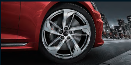
アルミホイール 5アームトラペゾイドデザイン 9J×20 +275/30 R20タイヤ