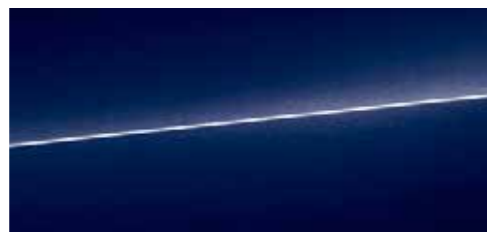
ナバーブルー メタリック