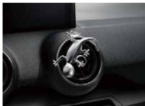
デザインゲッコー アルミ塗装のゲッコーマスコット。エアVENTに差し込んだり、マグネットでお好みの場所に固定できます。