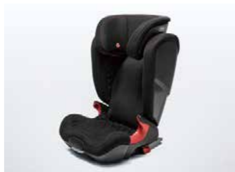
チャイルドシート Kidfix XP 幼児用シートは卒業、という小学生以下の児童用ジュニアシートです。ISO FIX固定フックとの一体型なので取り付けも簡単で、しかも安全です。座面を分割可能。22kgを超えるお子さま用に単独で使えます。ヘッドレスト、背もたれの角度調整が可能です。カラー：ブラック