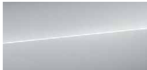
フロレットシルバー メタリック