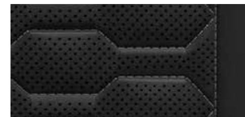
ブラック (ロックグレーステッチ) [バルコナレザー]