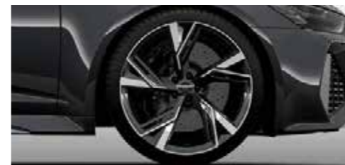
アルミホイール 5Vスポークグロスアンササイトブラック 10.5J×22*