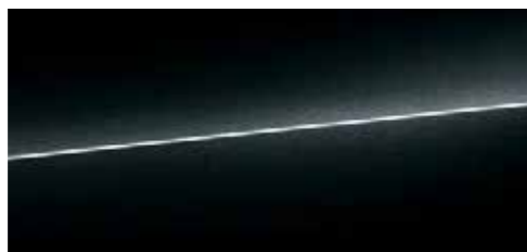
ミトブラック メタリック