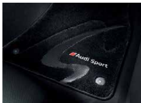
フロアマット(プレミアムスポーツ) 高密度カーベットにリアルカーボンとアルミニウム製のエンブレムを使用。素材には花粉等のアレルギー物質を吸着し、雑菌の増殖を抑制させる「プレミアムクリーン」を使用した、車内をクリーンに保つ、高品質なフロアカーベットです。カラー：ブラック