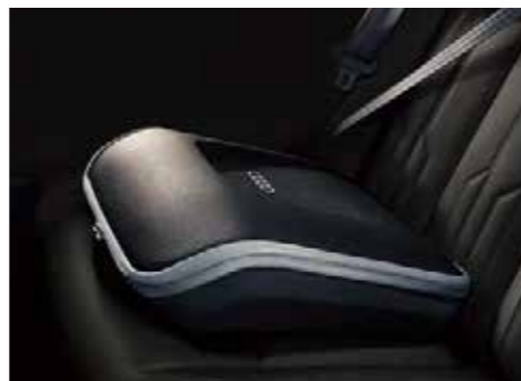
ビジネスケース 15インチまでのノートパソコンやビジネスツールの収納が可能なケース。助手席等にシートベルトで固定する他、ショルダーバッグとして持ち運ぶことも可能です。