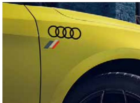
ヘリテージフラッグ&4リングフィルム ヘリテージフラッグ付きAudiマークのフィルムです。カラーはブラックとシルバーの2種類をご用意しています。