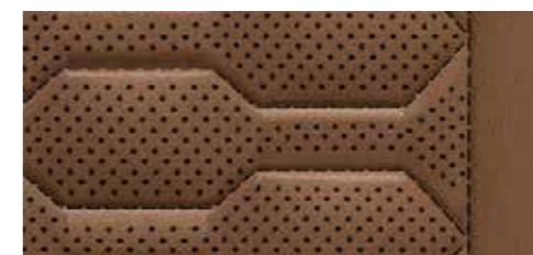
コニャックブラウン (ロックグレーステッチ) [バルコナレザー]