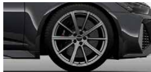
アルミホイール 10スポークスターデザイン 10.5J×21+275/35R21タイヤ