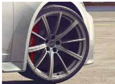
10スポークスターデザインアルミホイール 10.5J-21、インセット19、PCD112 (ウインタータイヤ用)

Audiの美しいスタイリングや高い実用性をさらに輝かせる、数々の純正アクセサリをご用意いたしました。Audiと過ごす時間をひととき心地よく、さらに自分らしく。あなたにとってこの上なく魅力的なAudiに仕立ててください。