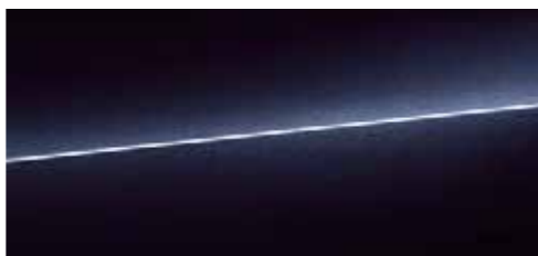
セブリングブラック クリスタルエフェクト