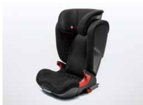
チャイルドシート Kidfix XP 幼児用シートは卒業、という小学生以下の児童用ジュニアシートです。ISO FIX固定フックとの一体型なので取り付けも簡単で、しかも安全です。座面を分割可能。22kgを超えるお子さま用に単独で使えます。ヘッドレスト、背もたれの角度調整が可能です。カラー：ブラック