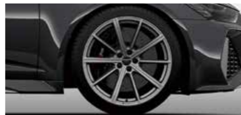
アルミホイール 10スポークスターデザイン 10.5J×21+275/35R21タイヤ