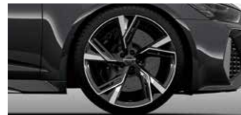
アルミホイール 5Vスポークグロスアントラサイトブラック 10.5J×22*