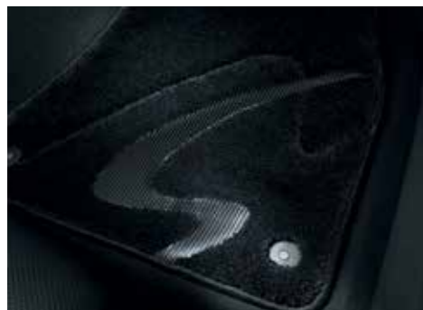
フロアマット(プレミアムスポーツ) 高密度カーペットにリアルカーボンとアルミニウム製のエンブレムを使用。素材には花粉等のアレル物質を吸着し、雑菌の増殖を抑制させる「プレミアムクリーン」を使用した、車内をクリーンに保つ、高品質なフロアカーペットです。カラー：ブラック