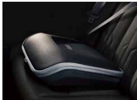
ビジネスケース 15インチまでのノートパソコンやビジネスツールの収納が可能なケース。助手席等にシートベルトで固定する他、ショルダーバッグとして持ち運ぶことも可能です。