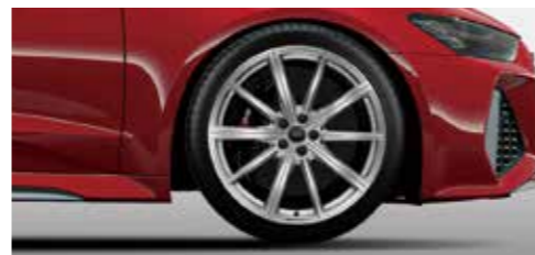
アルミホイール 10スポークスターデザイン 10.5J×21+275/35R21タイヤ