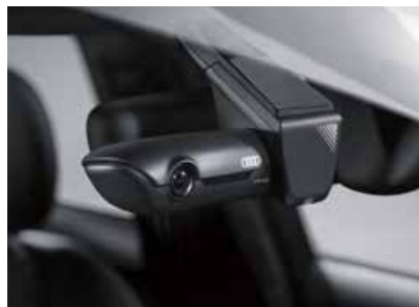
Audi ユニバーサルトラフィックレコーダー Audi専用デザインのドライブレコーダーです。専用アプリにてスマートフォン上で操作できます。レーダー感知作動による駐車監視や、イベントの自動録画、GPSによる自車位置検知など、多機能と高機能を兼ね備えています。フロント用とフロント&リヤ用があります。