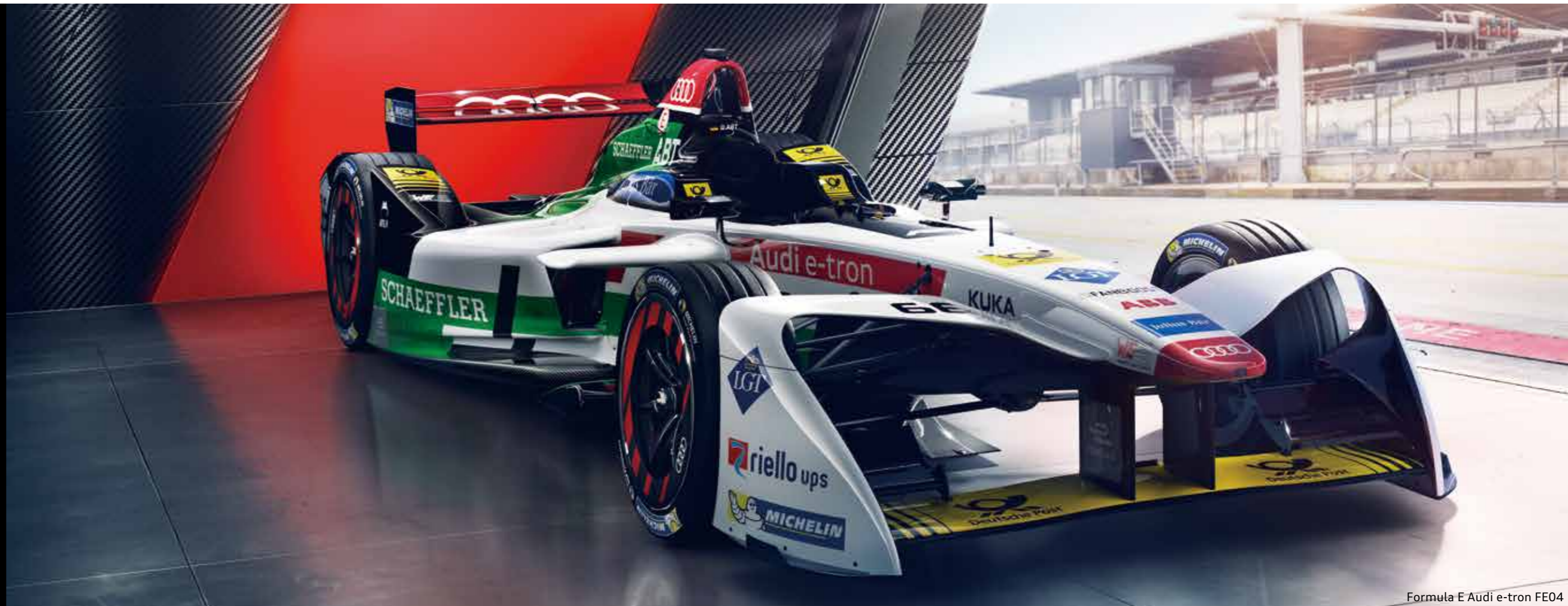
Formula E Audi e-tron FE04

Formula Eで参加初年度チーム優勝。 Audiの創生期から、電気自動車の未来の技術を磨くFormula Eまで。 モータースポーツへの挑戦こそ、進化の原動力。