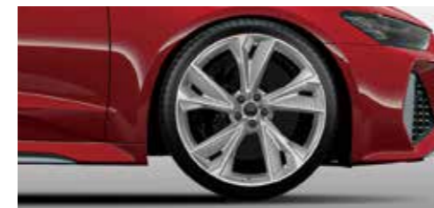
アルミホイール 5Vスポークデザイン マットチタニウムルック グロスフィニッシュ 10.5J×22+285/30R22タイヤ*