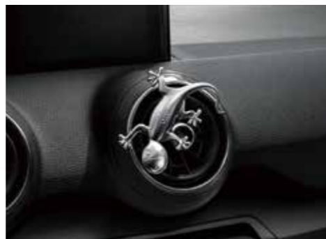
デザインゲッコー アルミ塗装のゲッコーマスコット。エアVENTに差し込んだり、マグネットでお好みの場所に固定できます。