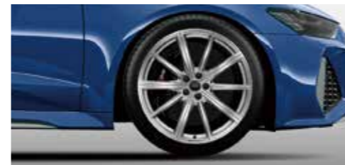
アルミホイール 10スポークスターデザイン 10.5J×21+275/35R21タイヤ