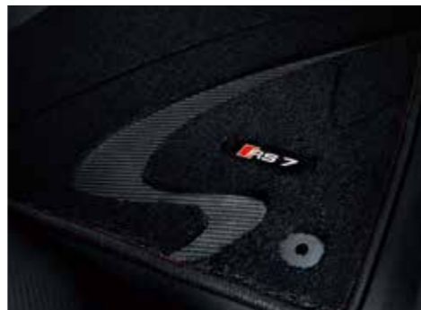
プレミアムスポーツフロアマット 高密度カーペットにリアルカーボンとアルミニウム製のエンブレムを使用。素材には花粉等のアレル物質を吸着し、雑菌の増殖を抑制させる「プレミアムクリーン」を使用した、車内をクリーンに保つ、高品質なフロアカーペットです。カラー：ブラック