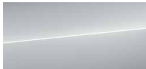
フロレットシルバー メタリック