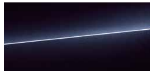
セブリングブラック クリスタルエフェクト