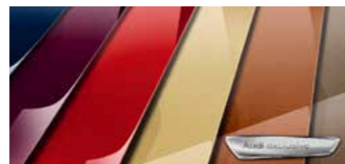
スペシャルボディカラー (Audi exclusive)*