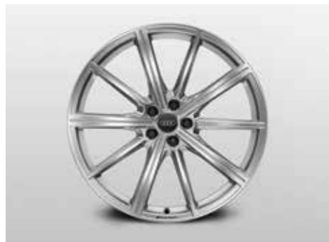
10スポークスターデザインアルミホイール 10.5J-21、インセット19、PCD112 (ウインタータイヤ用)

Audiの美しいスタイリングや高い実用性をさらに輝かせる、数々の純正アクセサリをご用意いたしました。Audiと過ごす時間をひととき心地よく、さらに自分らしく。あなたにとってこの上なく魅力的なAudiに仕立ててください。