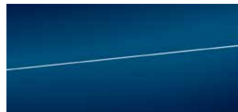
アスカリブルー メタリック