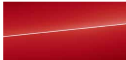
タンゴレッド メタリック