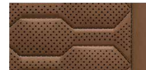
コニャックブラウン (フィールドグレーステッチ) [バルコナレザー]