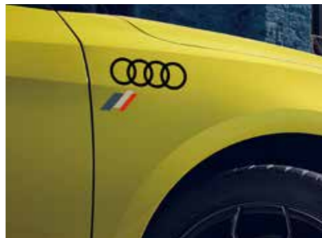
ヘリテージフラッグ&4リングフィルム ヘリテージフラッグ付きAudiマークのフィルムです。カラーはブラックとシルバーの2種類をご用意しています。