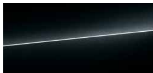
ミストブラック メタリック