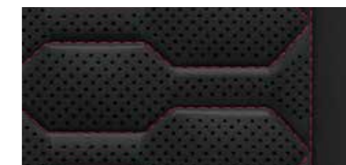
ブラック (エクスプレスレッドステッチ) [バルコナレザー]