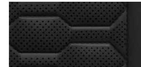
ブラック [バルコナレザー]