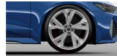
アルミホイール 5Vスポークデザイン マットチタニウムルック グロスフィニッシュ 10.5J×22+285/30R22タイヤ*