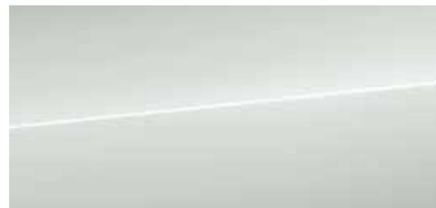
グレイシアホワイト メタリック