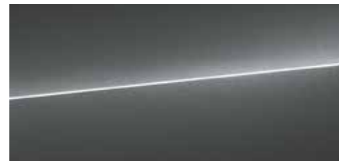
デイトナグレー パールエフェクト