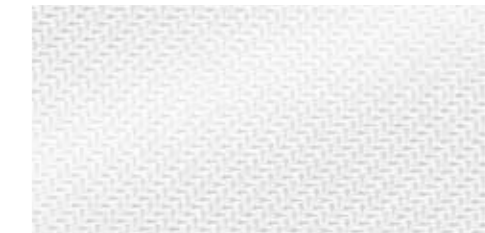
アルミニウムメース