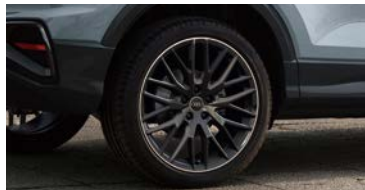
アルミホイール 10Yスポークデザイン グロスブラック 8J×19+235/40 R19(Audi Sport)