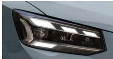
マトリクスLEDヘッドライト ダイナミックターンインディケーター(フロント/リヤ)