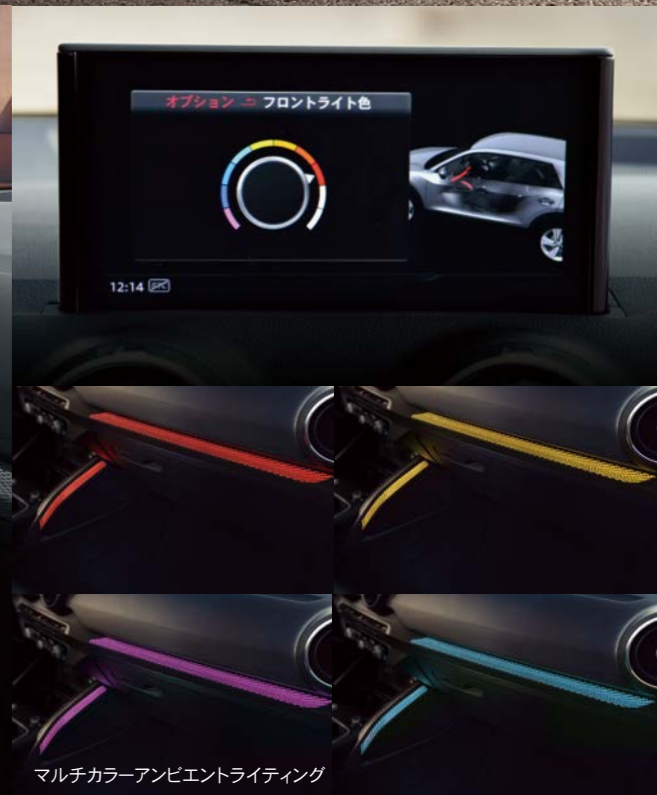
マルチカラーアンビエントライティング