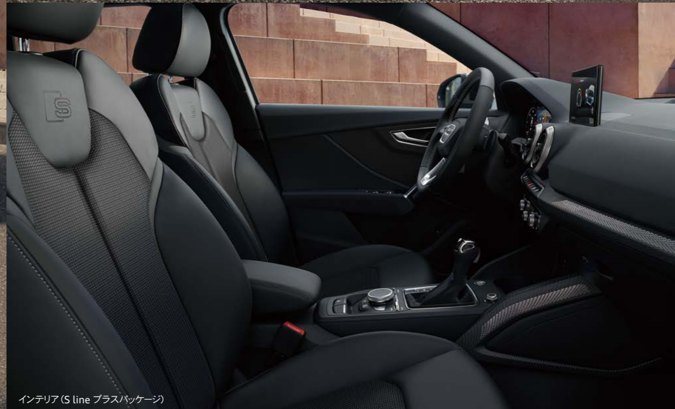
インテリア (S line プラスパッケージ)