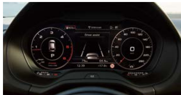
バーチャルコックピット