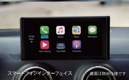
スマートフォンインターフェイス