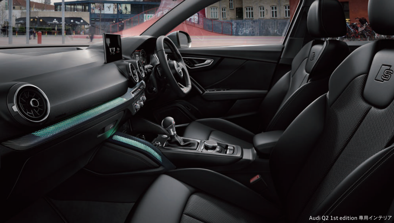
Audi Q2 1st edition 専用インテリア