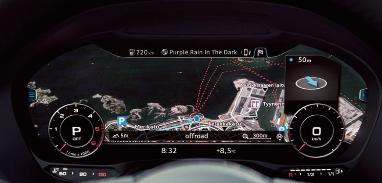
バーチャルコックピット

* 表示されるコンテンツ、アプリについては Apple Inc. または Google Inc. に指定されたもののみ表示可能となります。