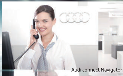
Audi connect Navigator