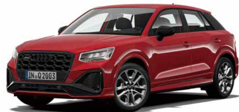
ブラックAudi rings & ブラックスタイリングパッケージ 装着イメージ