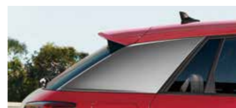
ブレード/マットチタングレー [標準装備]