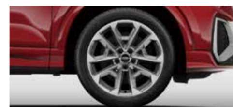
アルミホイール 5Vスポークスタイル 8)×18+235/45 R18タイヤ [標準装備]