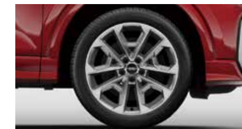
アルミホイール 5Vスポークスタイル 8J×18+235/45 R18タイヤ