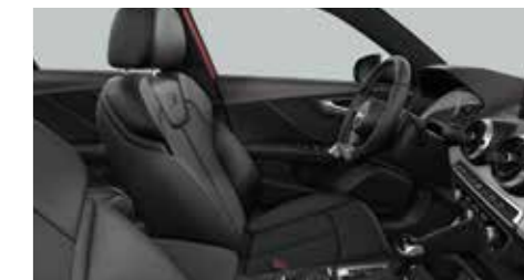
スポーツシート (フロント) / クロスレザー