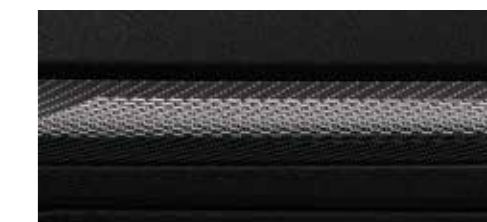
ライトグラフィック(マルチカラーアンビエントライティング専用) [SQ2インテリアデザインパッケージとしてセットオプション]