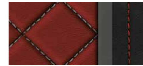
マグマレッド(ロックグレーステッチ)&ブラック(エクスペレスレッドステッチ) [ファインナップレザー] [SQ2インテリアデザインパッケージとしてセットオプション]