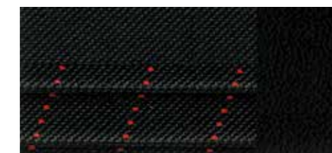
ブラック(エクスペレスレッドステッチ) [クロス/レザー] [標準装備]