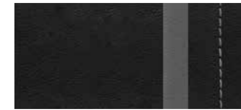
ブラック(ロックグレーステッチ) [ファインナップレザー] [オプション]