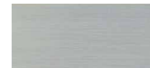
マットブラッシュアルミニウム [標準装備]