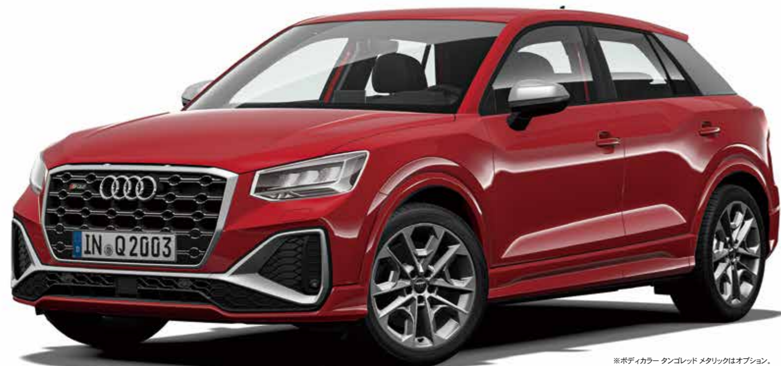
※ボディカラー タンゴレド メタリックはオプション。

4WDシステムquattro搭載。 走りへの自信が全身に漲る、Sの称号に相応しいハイパフォーマンスモデル。