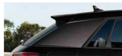
ブレード/マンハッタングレー メタリック [ブラックAudi rings&ブラックスタイリングパッケージとして セットオプション。 ボディカラー「ミストブラック メタリック」選択時]