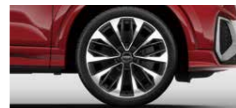
アルミホイール 5Vダブルスポークデザイン グラファイトグレー 8)×19+235/40 R19タイヤ [オプション]