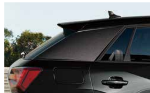
ブレード マンハッタングレー メタリック装着イメージ