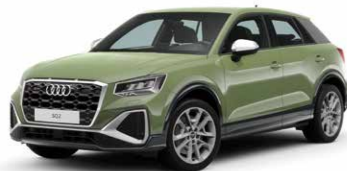
※写真はアップルグリーン メタリック/マンハッタングレー メタリック(ボディカラー/コントラストペイント)です。