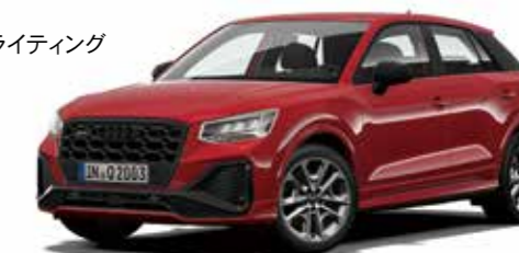
ブラックAudi rings&ブラックスタイリングパッケージ