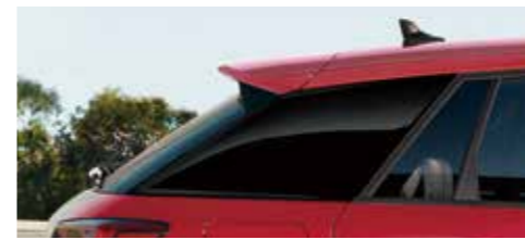
ブレード/プリリアントブラック [ブラックAudi rings&ブラック スタイリングパッケージとして セットオプション。 ボディカラー「ミストブラック メタリック」選択時は装備 できません。]