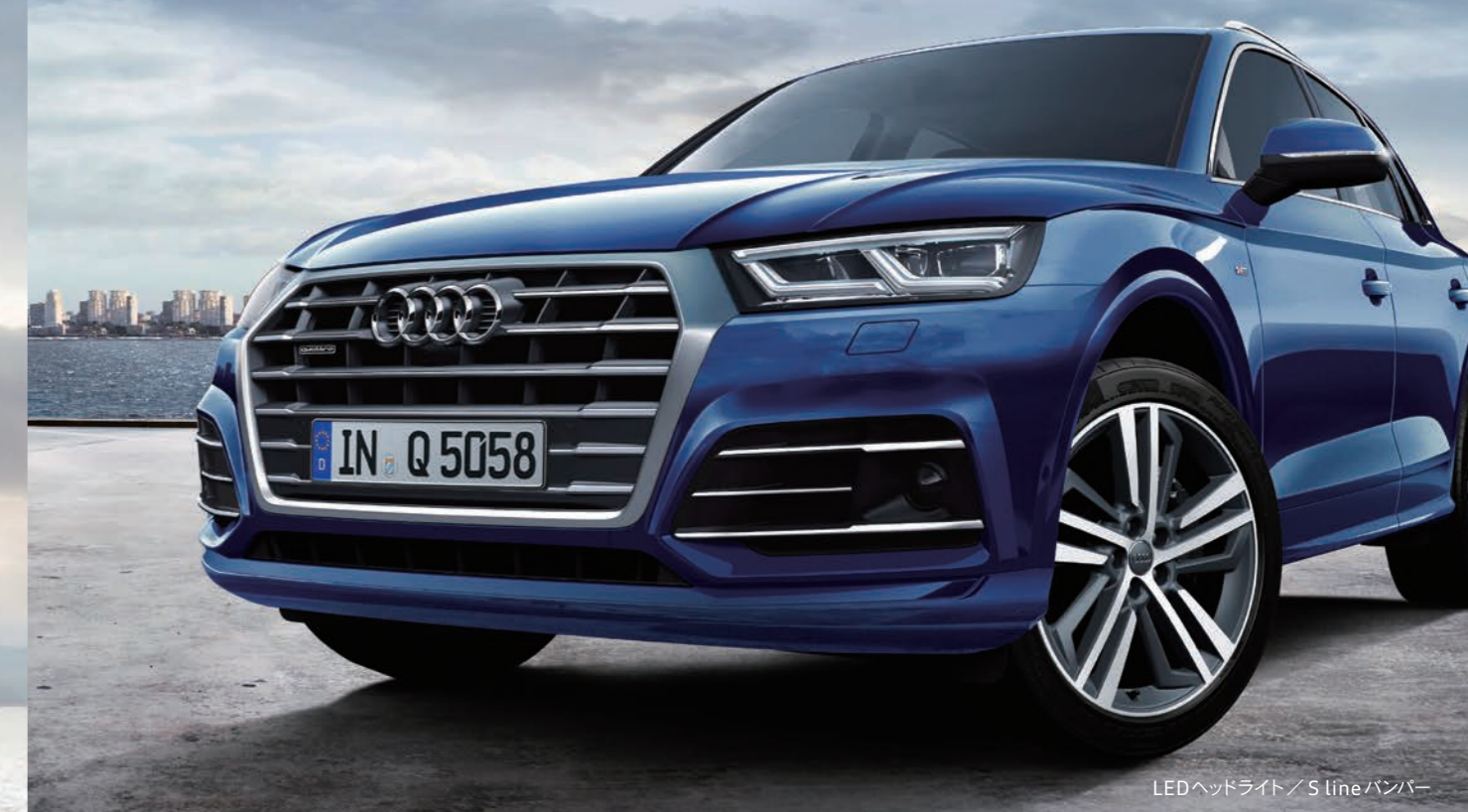
LEDヘッドライト / S lineバンパー