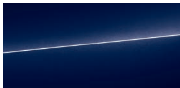
ナバーラブルー メタリック