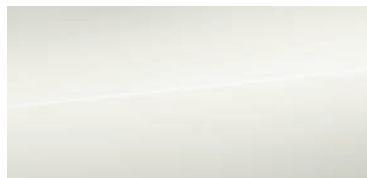
アイビスホワイト