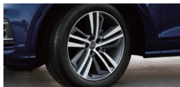
アルミホイール5セグメントスポークコントラストグレーポリッシュ 8J×20+255/45 R20タイヤ