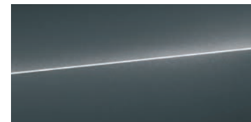
モンズングレー メタリック