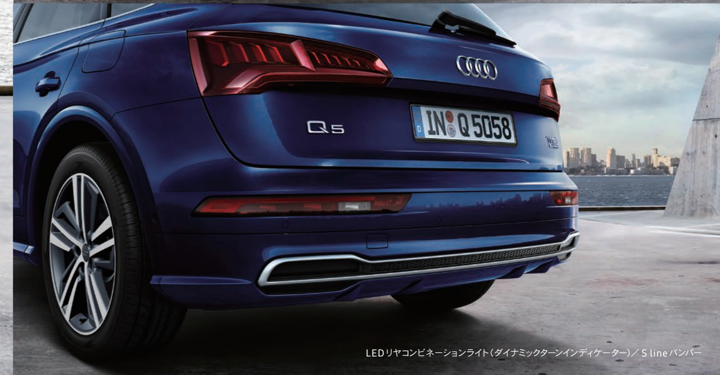
LEDリヤコンビネーションライト(ダイナミックターンインディケーター) / S lineバンパー