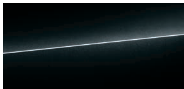
ミストブラック メタリック