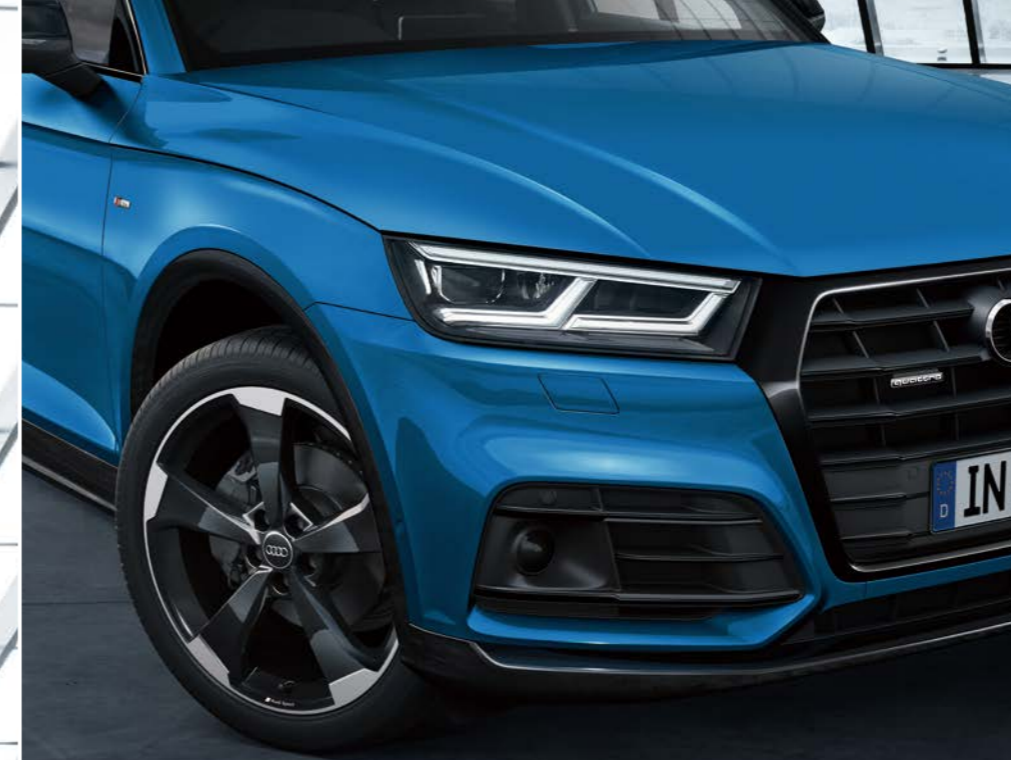
マトリクスLEDヘッドライト／ダイナミックターンインディケーター シングルフレームグリル(ブラックスタイリングパッケージ) アルミホイール 5アームローターデザイン グロスブラック (Audi Sport) 8J×20+255/45 R20タイヤ