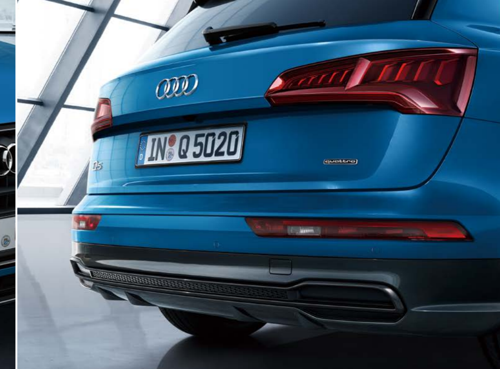
LEDリヤコンビネーションライト／ダイナミックターンインディケーター リヤディフューザー(ブラックスタイリングパッケージ)