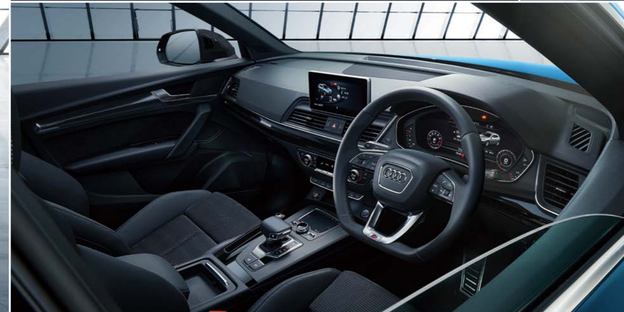
デコラティブパネル ピアノブラック ステアリングホイール 3スポークレザー マルチファンクション フラットボトム