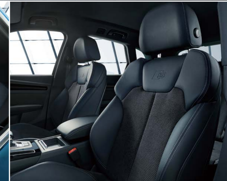
スポーツシート(フロント)／アルカンターラレザー S lineロゴ