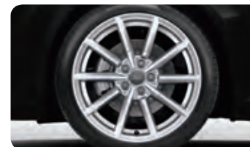
アルミホイール 10スポークデザイン 8.5J×18 +245/40R18タイヤ