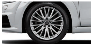
アルミホイール 20スポークVデザイン 8.5J×18 +245/40R18タイヤ