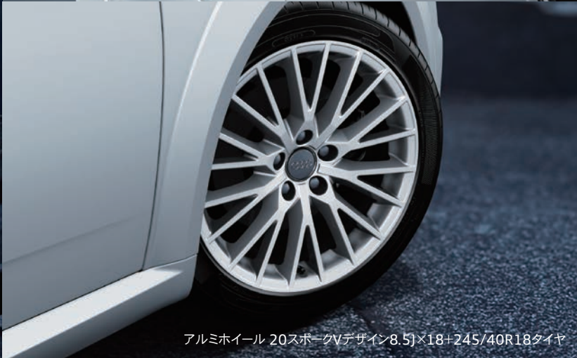
アルミホイール 20スポークVデザイン8.5J×18+245/40R18タイヤ