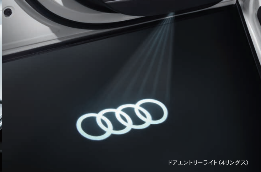
ドアエントリーライト(4リングス)