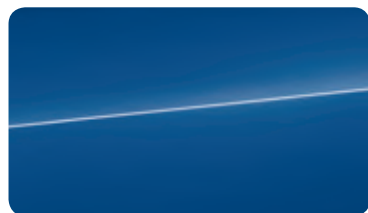
ノガロブルー パールエフェクト(Audi exclusive)