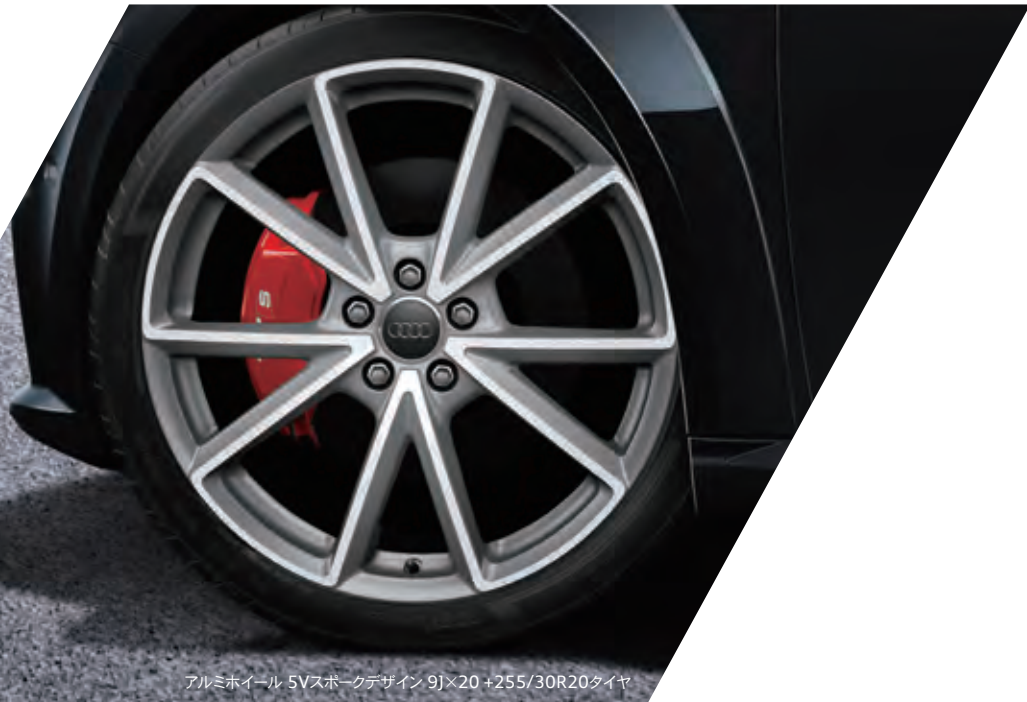
アルミホイール 5Vスポークデザイン 9J×20 +255/30R20タイヤ