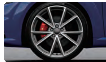
アルミホイール 5Vスポークデザイン 9J×20 +255/30R20タイヤ