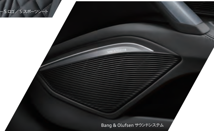
Bang & Olufsen サウンドシステム