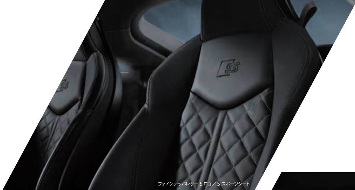
ファインナッパレザースロゴ/Sスポーツシート