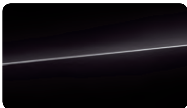
ミストブラック メタリック