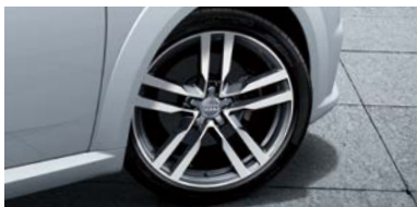
アルミホイール5アームスターデザインコントラストグレー パトリポリッシュ9J×19 245/35 R19タイヤ (Audi TT Coupé 2.0 TFSI quattro style+の場合)