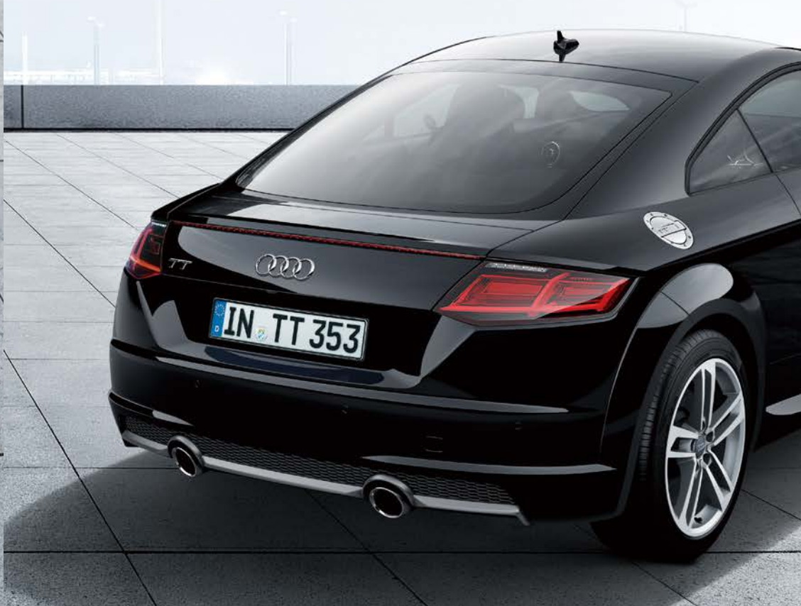
リヤデュフューザー(プラチナムグレー) [S lineエクステリア]、LEDダイナミックターンインディケーター(リヤ) / Audi TT Coupé 1.8 TFSI style+