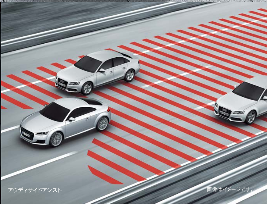
オーディオサイドアシスト