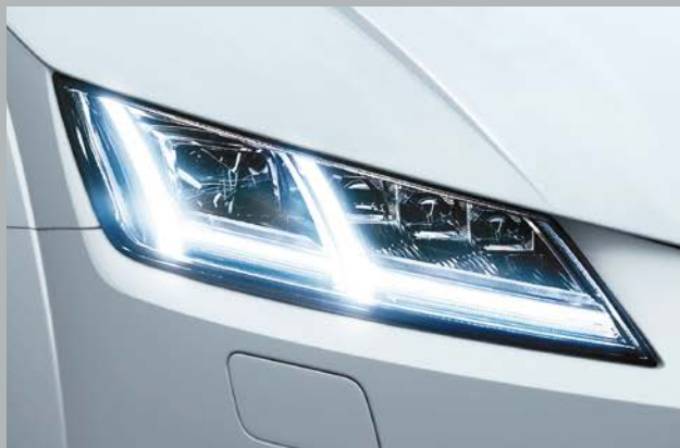
マトリクスLEDヘッドライト+ダイナミックターンインディケーター (フロント/リヤ)