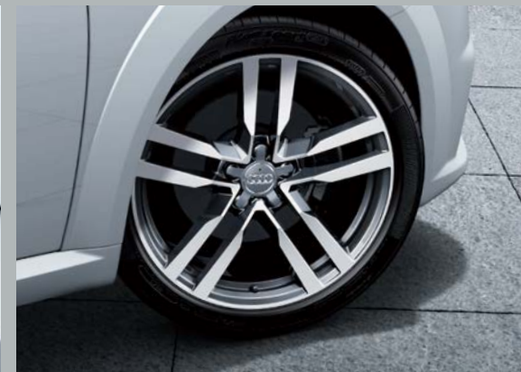
アルミホイール5アームスターデザインコントラストグレー パートリーポリッシュ9J×19 245/35 R19タイヤ