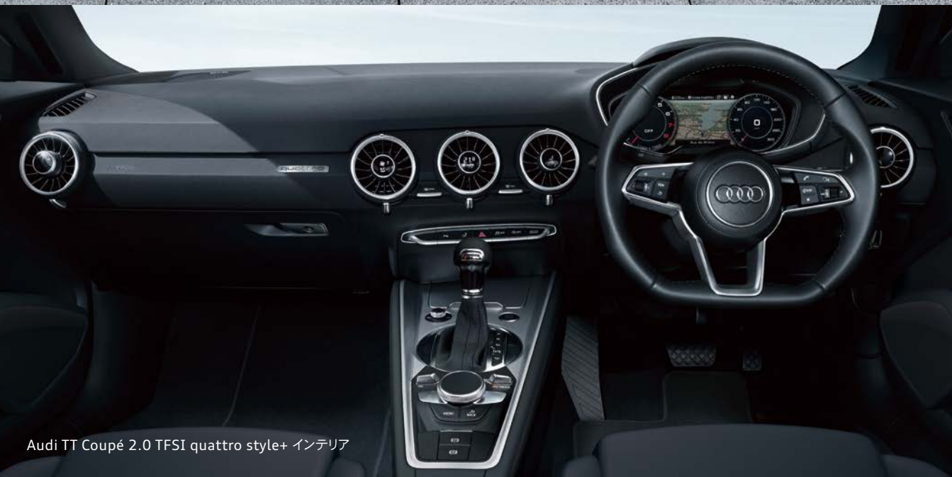
Audi TT Coupé 2.0 TFSI quattro style+ インテリア