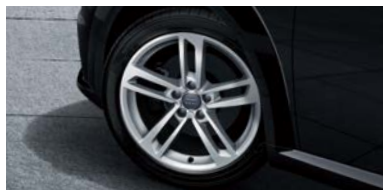
アルミホイール5ツインスポークダイナミック 8.5J×18 245/40 R18タイヤ (Audi TT Coupé 1.8 TFSI style+の場合)