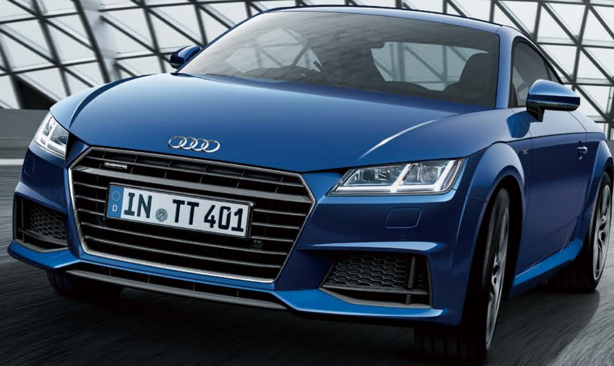
Audi TT Coupé 2.0 TFSI quattro style+