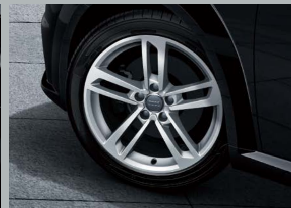
アルミホイール5ツインスポークダイナミック8.5J×18 245/40 R18タイヤ