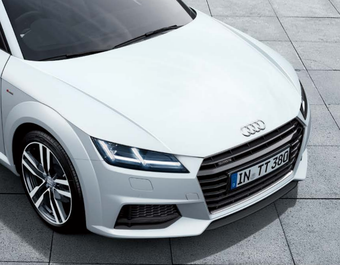
S line バンパー、ランエーターグリル(ハイグロスブラック) [S lineエクステリア] / Audi TT Coupé 2.0 TFSI quattro style+