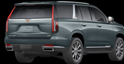
サイプレスメタリック