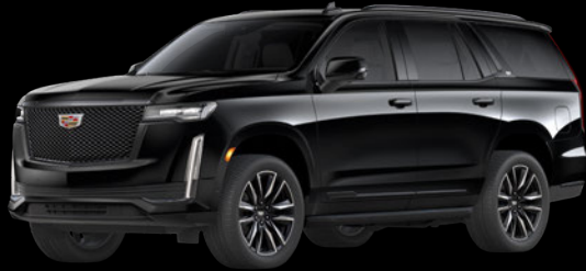
セーブルブラック