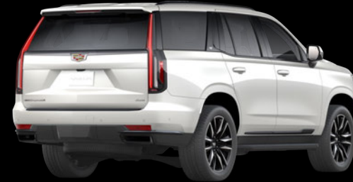
クリスタルホワイトトリコート