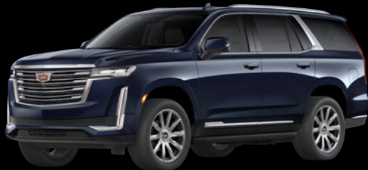
ダークムーンブルーメタリック