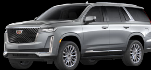
アージェントシルバーメタリック