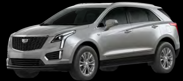
シャークスキンメタリック *