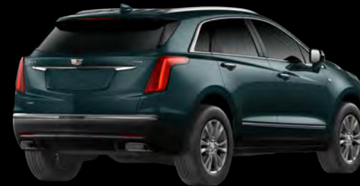
エメラルドレイクメタリック *