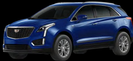
オペレントブルーメタリック