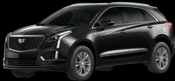
ステラーブラックメタリック *