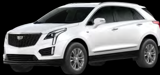
クリスタルホワイトトリコート *