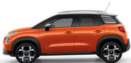
スパイシー オレンジ