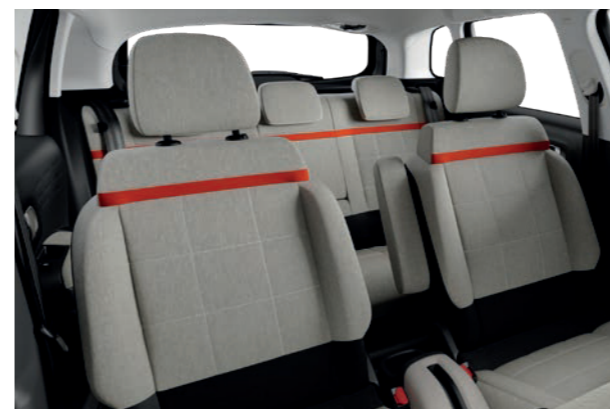
ファブリックシート(メトロポリタングレー)