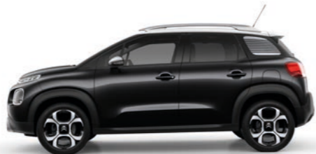
ノアール ペルラネラ