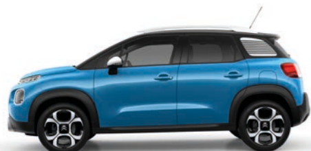
プリージング ブルー