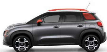
グリス プラチナム