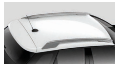
ナチュラル ホワイト