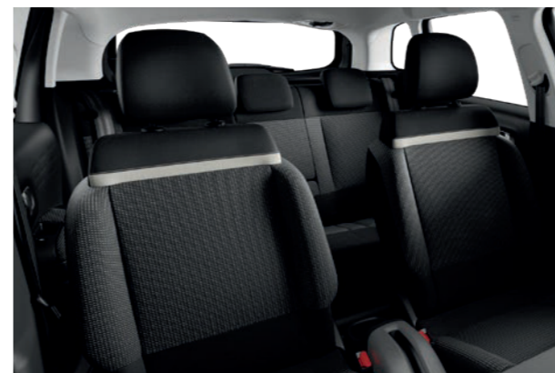
ファブリックシート(ブラック)