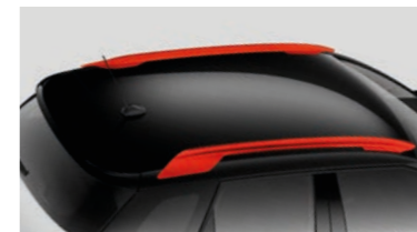
ノアール ペルラネラ