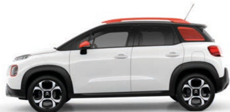
ナチュラル ホワイト