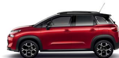
ルージュベッパー