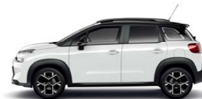
ブランバンキーズ