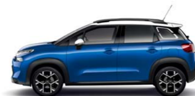
ボルタイックブルー