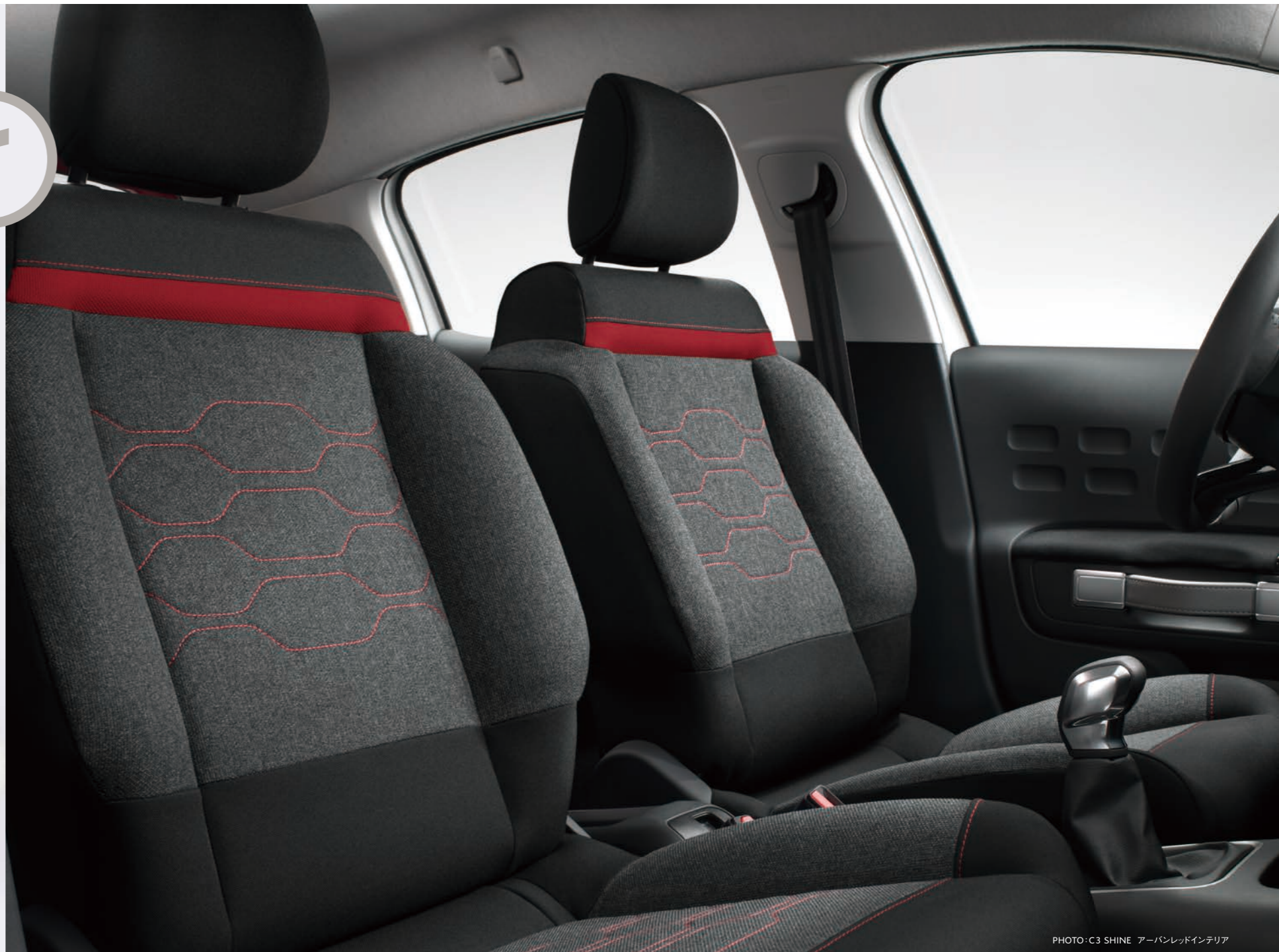
PHOTO: C3 SHINE アーバンレッドインテリア

室内にはシトロエンのアドバンスコンフォートが隅々にまで息づいています。 全長4m未満というコンパクトなボディのどこからこんなゆとりが生まれるのか。 まるでアームチェアのような幅広で心地良いシート、 広々としたレッグルーム、ショルダースペースもヘッドクリアランスも十分です。 緻密に作りこまれたシートは、伝統のしなやかなサスペンションと相まって、 柔らかく快適な乗り心地を生み出します。優れた静粛性も特筆ものです。 それはまるでリビングルームのような居心地の良さ。 考えてみれば、これほどの贅沢はありません。