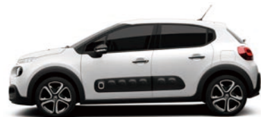
ブランバンキーズ