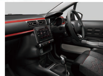
ファブリックシート (アーバンレッド)