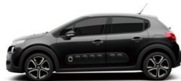
ノアールペルラネラ