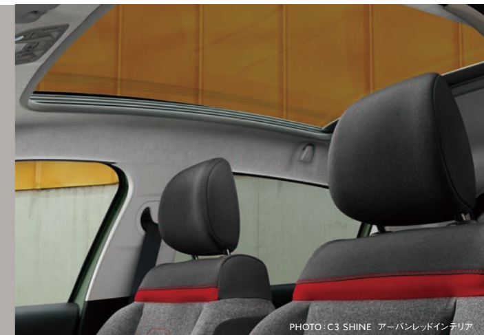
PHOTO: C3 SHINE アーバンレッドインテリア