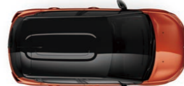
ノアールオニキス