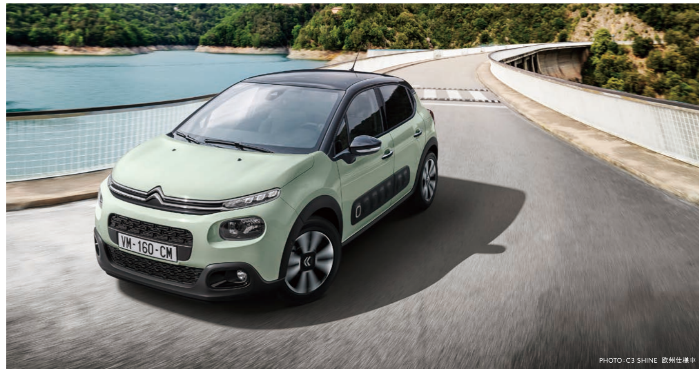
PHOTO: C3 SHINE 欧州仕様車

*特別塗装色(有料オプション)となります。詳しくは、シトロエン正規販売店にお問い合わせください。