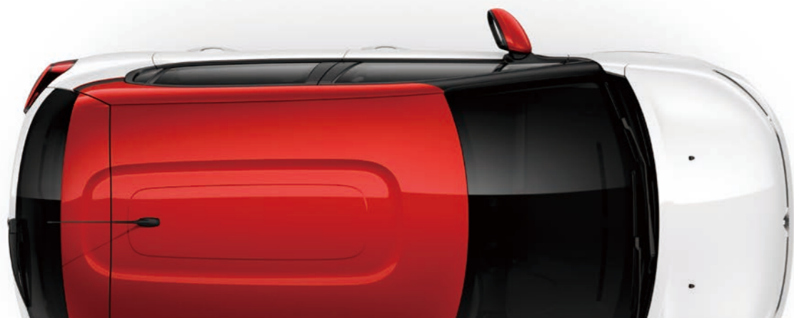
PHOTO:C3 SHINE 欧州仕様車