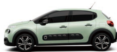
アーモンドグリーン