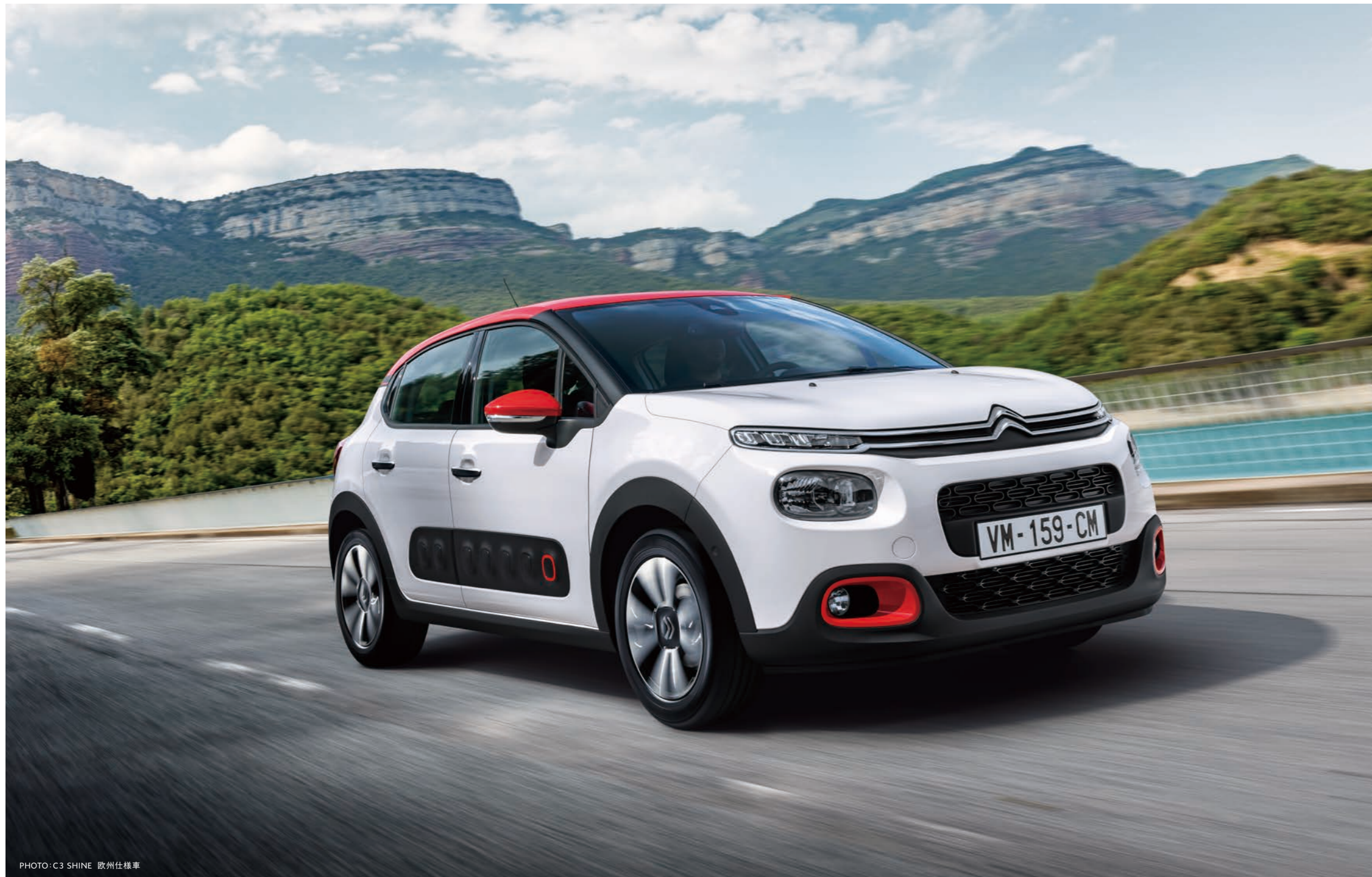
PHOTO: C3 SHINE 欧州仕様車