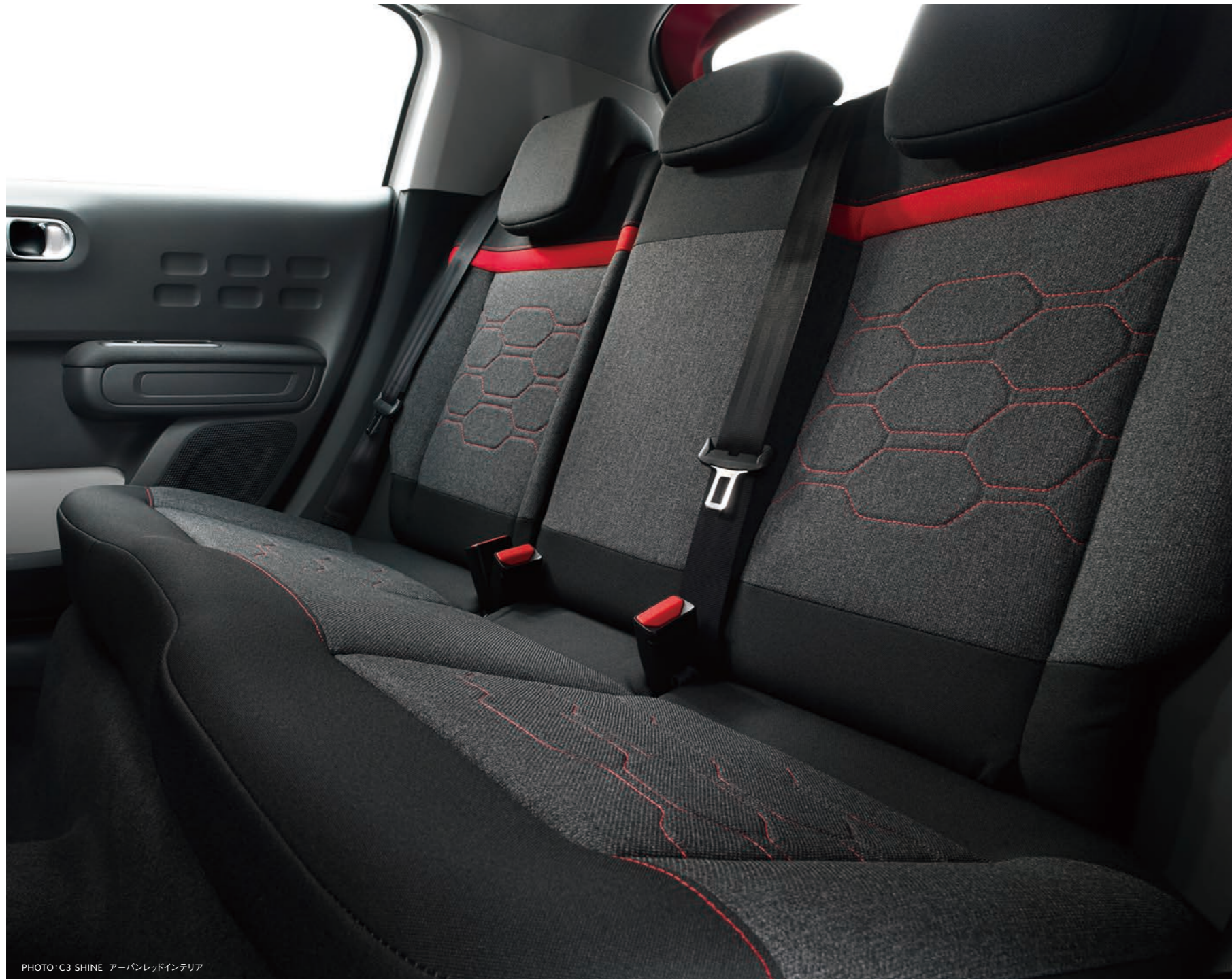
PHOTO: C3 SHINE アーバンレッドインテリア