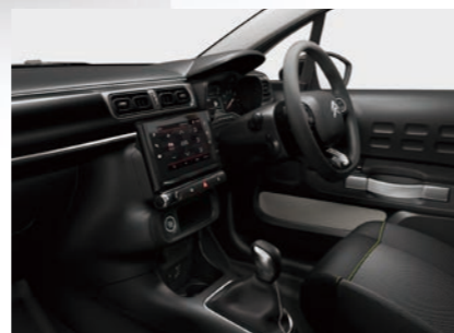
ファブリックシート (グレー)