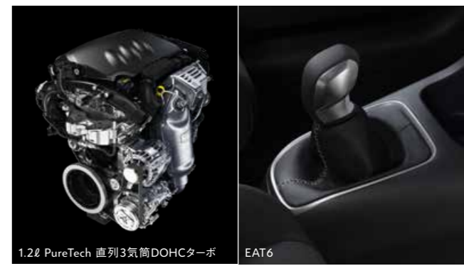
1.2ℓ PureTech 直列3気筒DOHCターボ