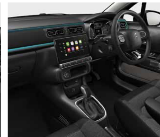
エメラルドインテリア(ファブリックシート)