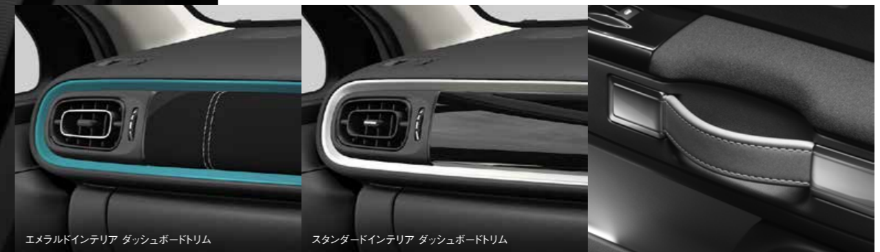
エメラルドインテリア ダッシュボードトリム

インテリアトリムは、シックな「スタンダード」と、鮮やかなエメラルドのアクセントカラーをコーディネートした「エメラルド」の2タイプを用意。旅行鞆をモチーフにしたドアストラップなど、デザインも個性的です。