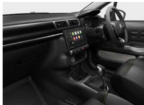
スタンダードインテリア(ファブリックシート)