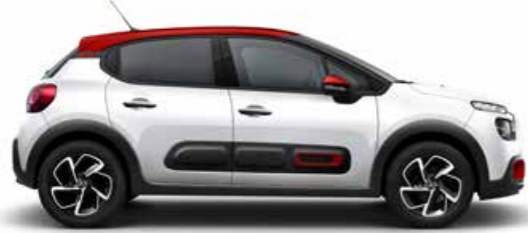
ブラン パンキーズ