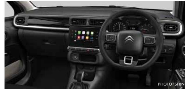
スタンダードインテリア