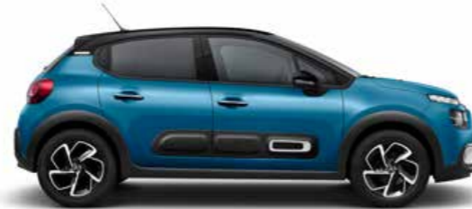
スプリング ブルー