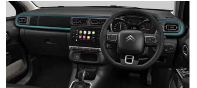
エメラルドインテリア