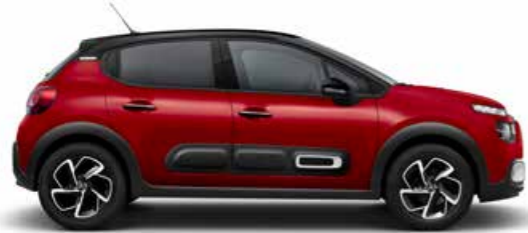
ルージュ エリクシール