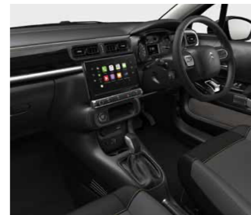
スタンダードインテリア(ファブリックシート)