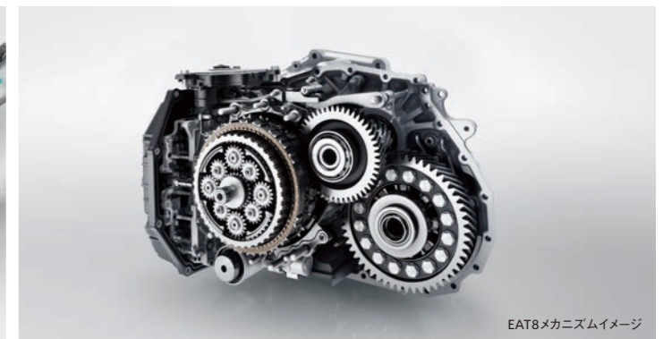
EAT8メカニズムイメージ