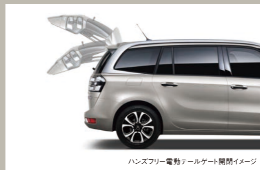
ハンズフリー電動テールゲート開閉イメージ