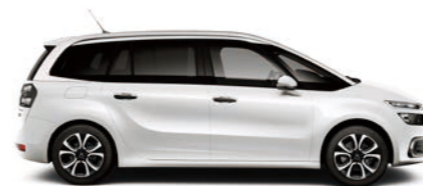
ブランパンキーズ