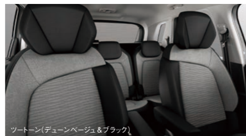
ツートーン(デュンページュ&ブラック)