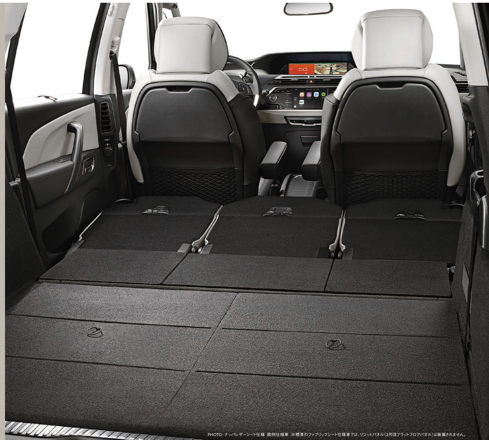
PHOTO: ナッパレザーシート仕様 欧州仕様車 ※標準のファブリックシート仕様車では、リジッドパネル(2列目フラットフロアパネル)は装備されません。