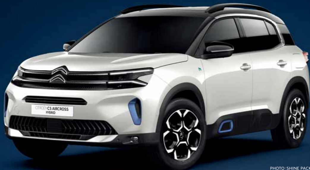
PHOTO: SHINE PACK PLUG-IN HYBRID