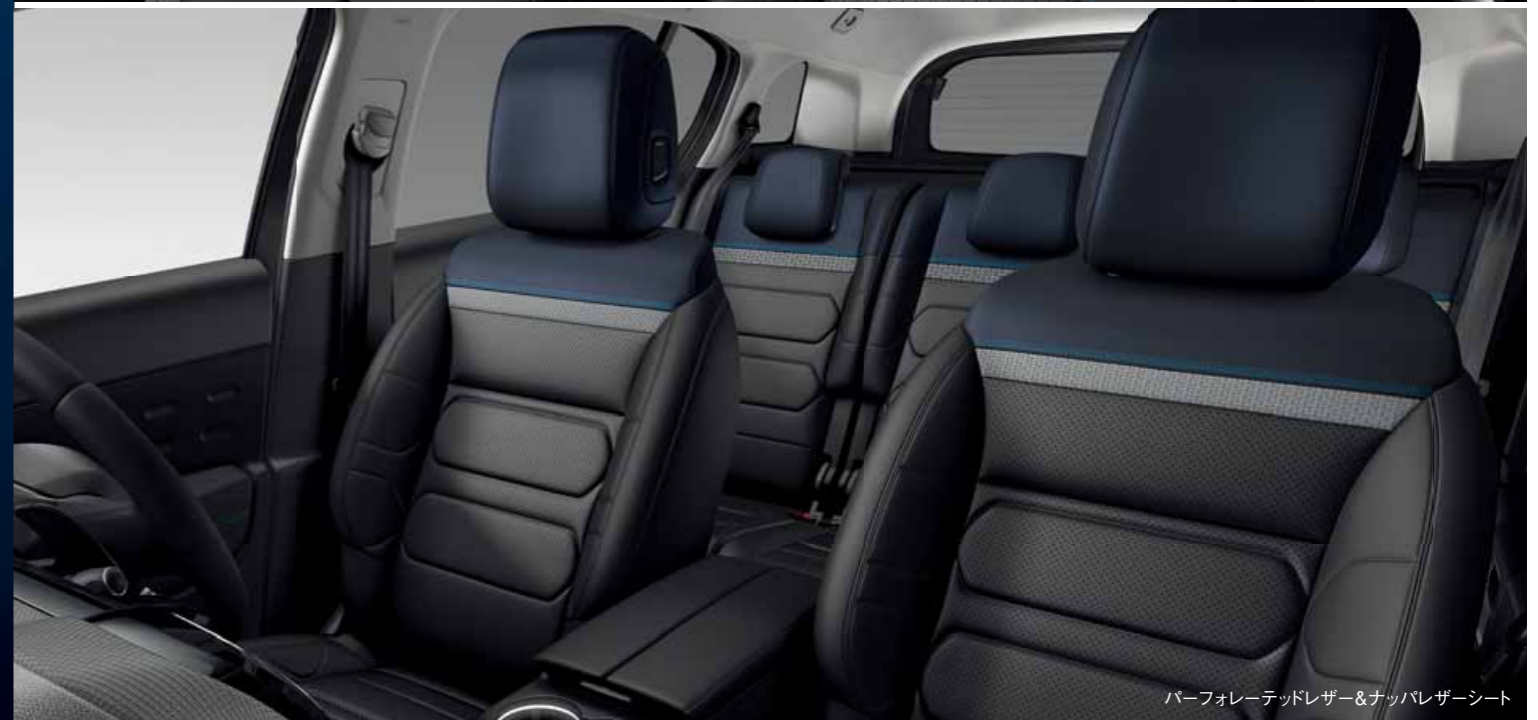
パーフォレーテッドレザー & ナップレザースーツ