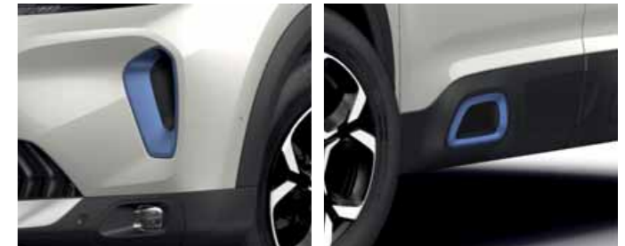
エナジックブルー(マット) (SHINE PACK PLUG-IN HYBRID)