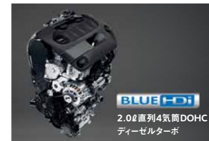
BLUE HDi 2.0ℓ直列4気筒DOHC ディーゼルトーボ