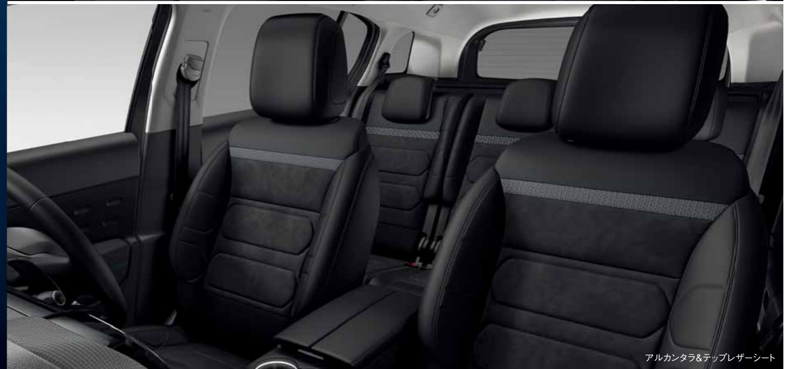
アルカンタラ&テップレザーシート