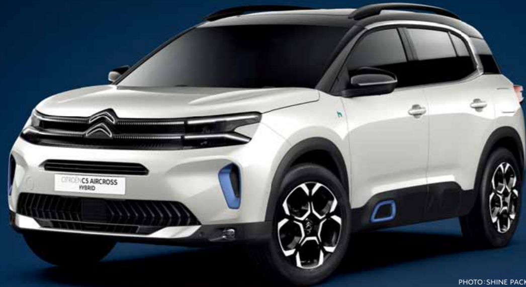
PHOTO: SHINE PACK PLUG-IN HYBRID