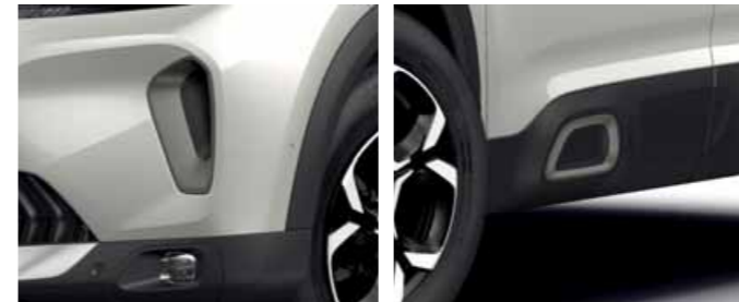
ダーククローム(マット) (SHINE BlueHDi/SHINE PACK BlueHDi)