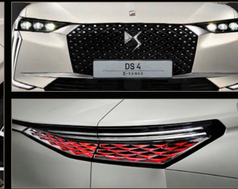
PHOTO:DS 4 E-TENSE